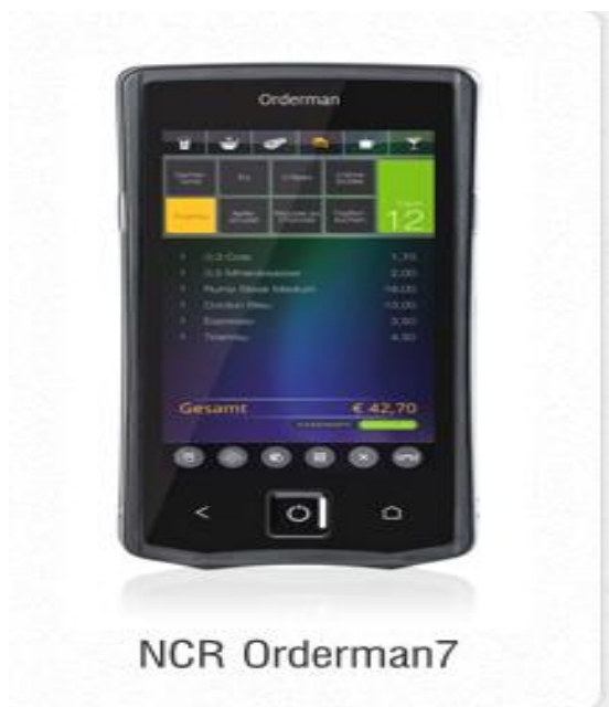
Slika 2: NCR Orderman 7

U svojoj ponudi Remaris također ima i NCR Orderman 7 koji ima jednake karakteristike kao i onaj koji nudi Gastrobit GRC grupa, ali je priključen na Remaris programe za ugostitelje. 27