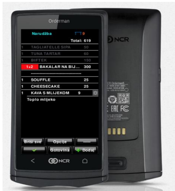
Slika 1: NCR Orderman 5