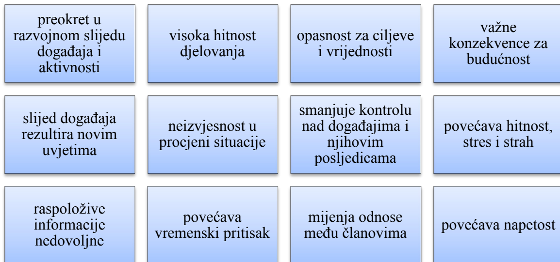
Slika 1: Dimenzije krize prema Wieneru i Kahnu

U poslovnom smislu, kriza je značajan poslovni poremećaj koji stimulira opsežnu medijsku pozornost (Schwartz ur. 2006:12). Nastalo temeljito proučavanje javnosti utjecat će na normalno poslovanje poduzeća, a može imati i politički, pravni, financijski i vladin utjecaj na poslovanje poduzeća (Verčič et al. 2004:132).