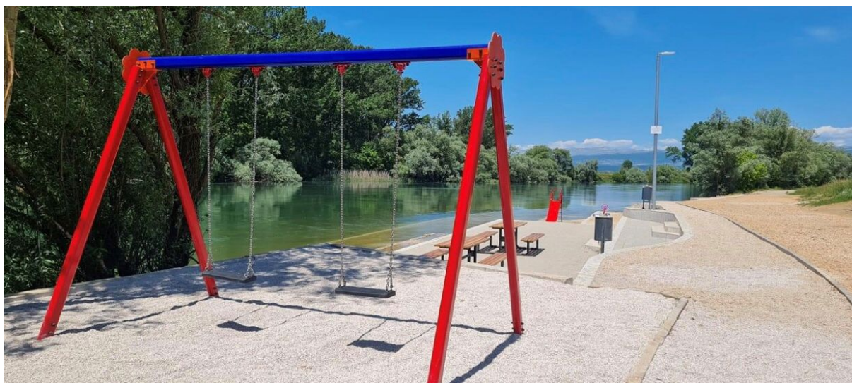
Slika 7. Plaža na rijeci Cetini, Drinić Veliki