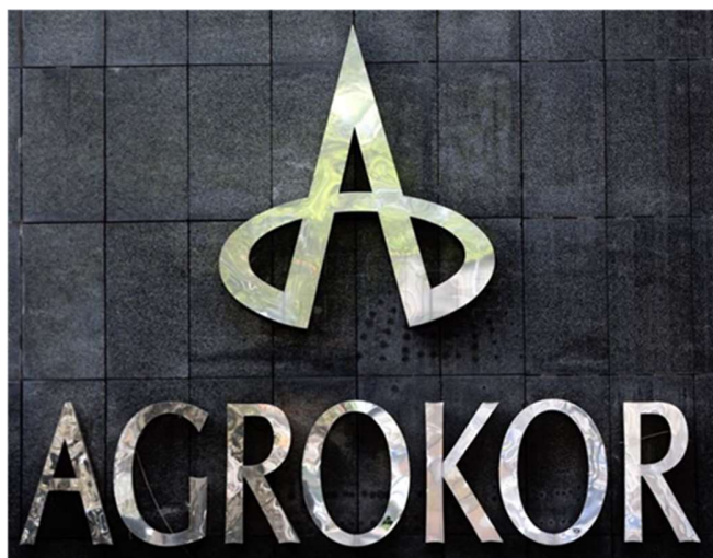
SLIKA 2. Logo tvrtke Agrokor Koncern