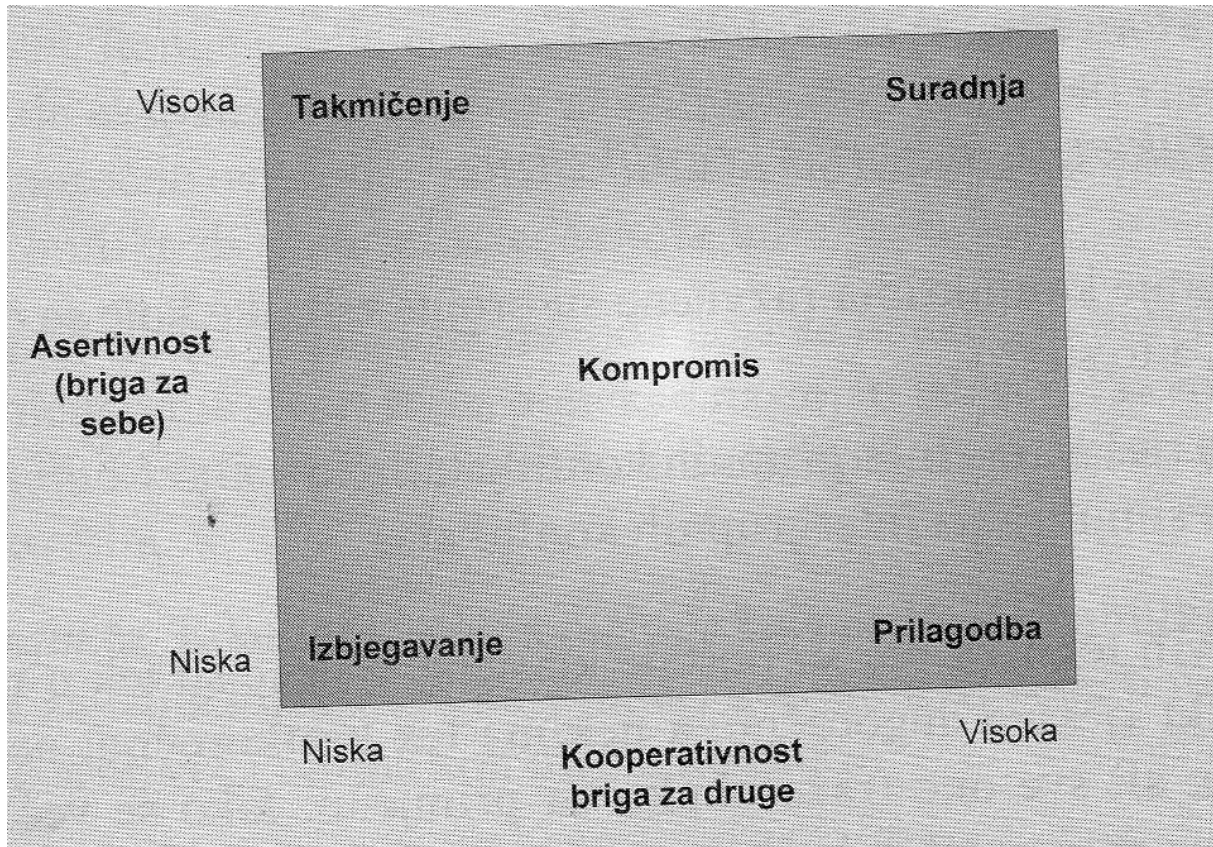
Slika 1. Model stilova upravljanja konfliktom