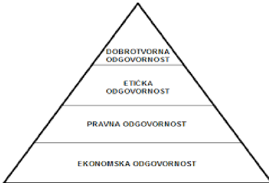
Slika 1 Hijerarhija DOP-a

Izvor: Buble, Menadžment, Split, 2009, str.101.