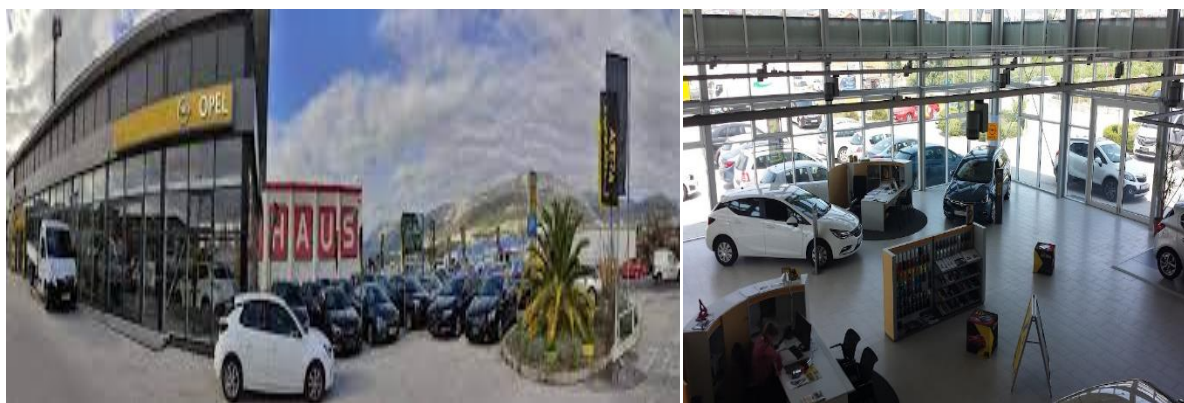
Slika 4 Vanjski i unutarnji prostor PSC Dalmacije d.o.o. Split

Grupa AVAG, u čijem je vlasništvu PSC Dalmacija (i još 3 podružnice u Hrvatskoj), također posluje u Njemačkoj i Austriji. Poljska, Mađarska.