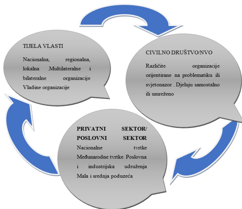
Slika 2 Partnerstva u stvaranju mreže za razvoj DOP-a

Uspostavom mreže upravlja Hrvatska gospodarska komora predlaže poslovnik mreže i pruža tehničku podršku za njezin rad. Plan rada mreže je rasprava i predlaganje aktivnosti usmjerenih na popularizaciju DOP-a, a moguće i formuliranje prijedloga strateških aktivnosti i razvoj međuresorne suradnje. Kako bi sve informacije o projektu bile dostupne i vidljive, pristup je omogućen izgradnjom jedinstvene web platforme na DOP-u. Sve informacije o hrvatskim aktivnostima u ovom području dostupne su na jedinstvenom portalu DOP-a, koji također sadrži informacije o svim relevantnim institucijama i njihovim aktivnostima u ovom području. Portal je nadopunjen bazom podataka primjera dobre prakse 32 i publikacija na tom području. Manifestaciju vodi Ekonomski fakultet Sveučilišta u Zagrebu uz potporu Hrvatskog saveza sindikata. Članstvo u Nacionalnoj mreži DOP-a je dobrovoljno - mreža povezuje udruge i partnerske organizacije (Sl. ) Predstavnike javnog, privatnog i civilnog sektora u Hrvatskoj koji promiču društveno odgovorno poslovanje.