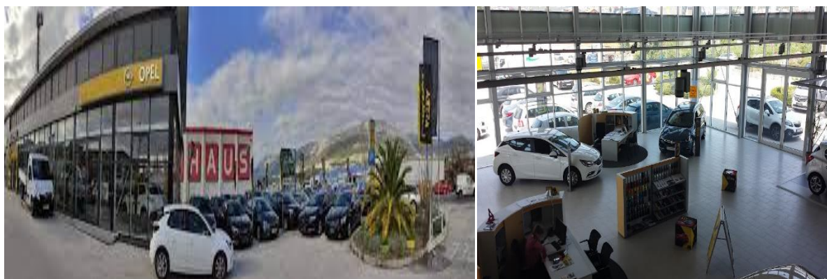
Slika 4 Vanjski i unutarnji prostor PSC Dalmacije d.o.o. Split

Grupa AVAG, u čijem je vlasništvu PSC Dalmacija (i još 3 podružnice u Hrvatskoj), također posluje u Njemačkoj i Austriji. Poljska, Mađarska.