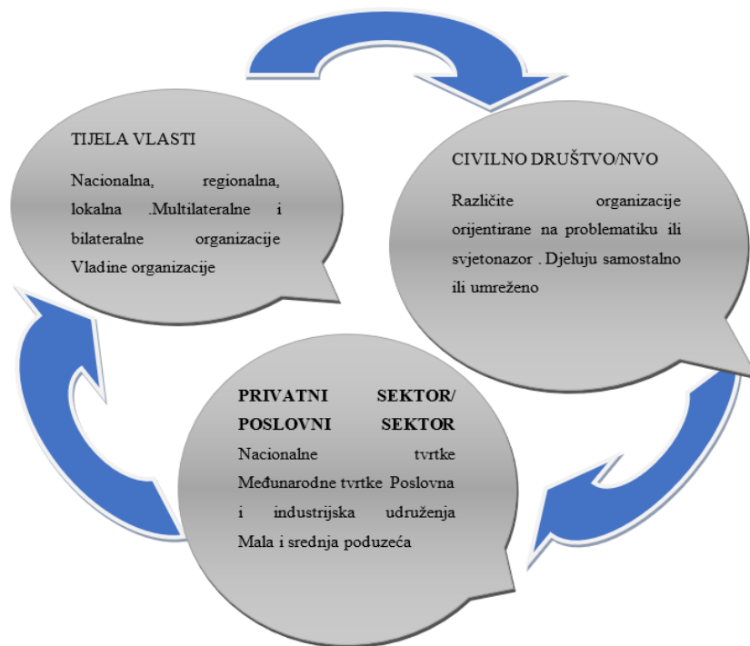
Slika 2 Partnerstva u stvaranju mreže za razvoj DOP-a

Uspostavom mreže upravlja Hrvatska gospodarska komora predlaže poslovnik mreže i pruža tehničku podršku za njezin rad. Plan rada mreže je rasprava i predlaganje aktivnosti usmjerenih na popularizaciju DOP-a, a moguće i formuliranje prijedloga strateških aktivnosti i razvoj međuresorne suradnje. Kako bi sve informacije o projektu bile dostupne i vidljive, pristup je omogućen izgradnjom jedinstvene web platforme na DOP-u. Sve informacije o hrvatskim aktivnostima u ovom području dostupne su na jedinstvenom portalu DOP-a, koji također sadrži informacije o svim relevantnim institucijama i njihovim aktivnostima u ovom području. Portal je nadopunjen bazom podataka primjera dobre prakse 32 i publikacija na tom području. Manifestaciju vodi Ekonomski fakultet Sveučilišta u Zagrebu uz potporu Hrvatskog saveza sindikata. Članstvo u Nacionalnoj mreži DOP-a je dobrovoljno - mreža povezuje udruge i partnerske organizacije (Sl. ) Predstavnike javnog, privatnog i civilnog sektora u Hrvatskoj koji promiču društveno odgovorno poslovanje.