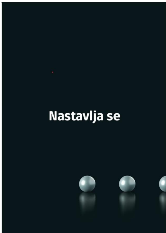
Slika 3 - Primjer skrivene faze – Plakat za konferenciju DUMP Days 2021.

Naime, ukoliko se odluči na skrivenu fazu potrebno je odraditi velik broj brainstorming sastanaka tijekom kojih će se odrediti koji će se kanali koristiti (tradicionalni marketing), kako će izgledati (mora biti usklađeno s cjelokupnim vizualnim identitetom) te što će pisati. S obzirom na manjak ljudskih resursa koji su bili raspoloživi za organiziranje aktivnosti DUMP Days konferencije 2022. godine, nije postojala skrivena faza marketinga. Međutim, za prošlogodišnju konferenciju se uspjela realizirati.