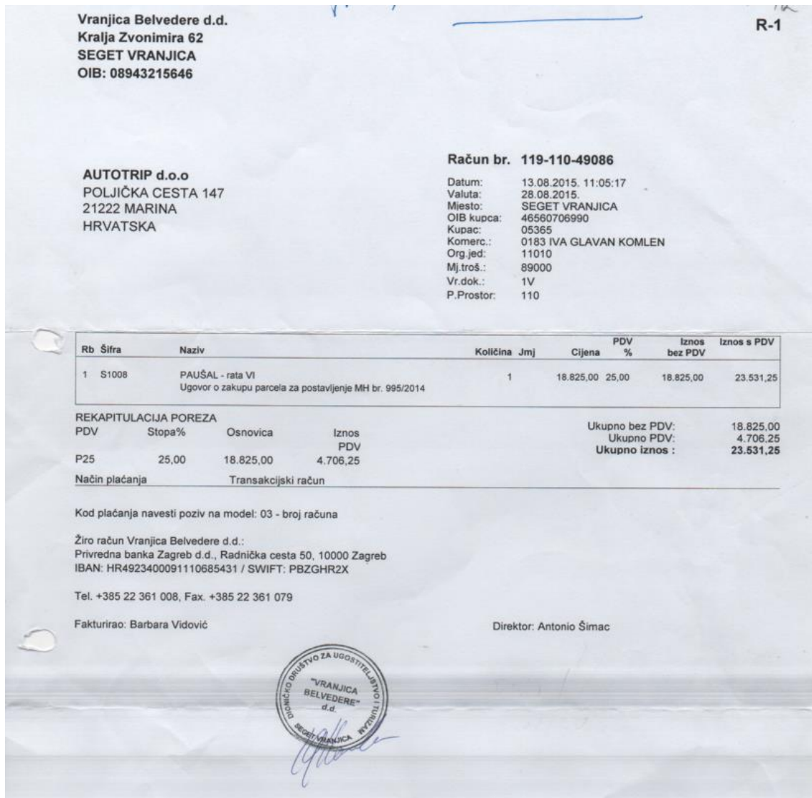
Slika 1: Primljeni račun od tvrtke „Vranjica Belvedere d.d.“

oznake. Račun je proknjižen kao primljeni račun u Glavnoj knjizi i Dnevniku, a kako bi se iskazao iznos pretporeza primljeni račun je proknjižen i u knjigu UR-a.