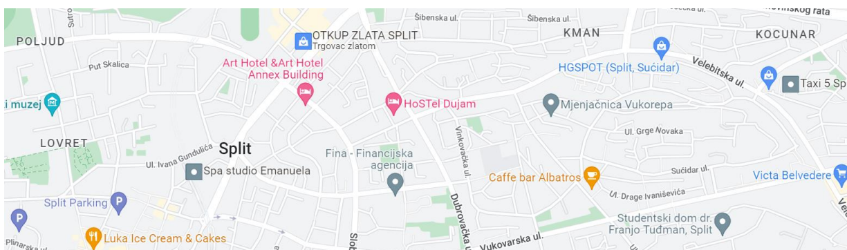
Slika 1. Područje grada Splita u kojem bi se tražila lokacija za najam