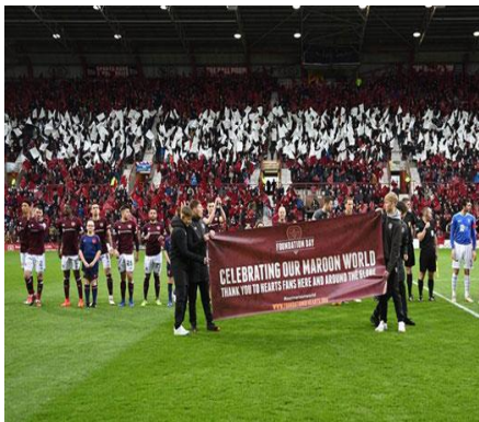
Slika 9: Ceremonija predstavljanja zaklade

Zaklada „The Foundation of Hearts“ je neprofitna organizacija koju je 2010. osnovala grupa lokalnih poslovnih ljudi, od kojih su svi dugogodišnji navijači kluba. Razlog osnivanja zaklade je zajednička i strastvena vizija za budućnost koja se temelji na vraćanju kluba ljudima koji ga vole i koji su zaslužni što je on onakav kakav je sad. Žele ga vratiti navijačima. Zakladi su se 2013. godine priključile sve podgrupe navijača (udruga dioničara, HYDC, Save our Hearts...). Potporu zakladi su pružili brojni političari, od lokalnih do onih u parlamentu sve u cilju unaprjeđenja vizije stjecanja vlasništva kluba.