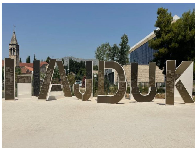
Slika 7: Idejno rješenje tematskog parka na Poljudu

1911. godine pa sve do danas. Izdavački dio ove monografije preuzela na sebe udruga Naš Hajduk, a na ovakav pothvat odlučila se tek nekolicina nogometnih klubova u svijetu. Ipak, glavna zahvala je ime donatora u tematskom parku posvećenom upravo njima, gdje će „za sva vremena“ biti upisani pored voljenoga kluba, tik uz glavni ulaz. Kao simbol ljubavi, tematski park krasit će imena preko 5.000 članova koji će ukupno, u obje navedene akcije donirati 7.500 kn ili više. U listopadu 2017. godine na tiskovnoj konferenciji udruga Naš Hajduk predstavila je detalje natječaja za idejno rješenje tematskog parka na Poljudu. Stručni žiri činili su predstavnici Hajduka i udruge Naš Hajduk dr. med. Ivan Rilov, tajnik Udruge Naš Hajduk; dipl. ing. geod. Slaven Marasović, predsjednik nadzornog odbora HNK Hajduk Split; dr.sc. Ivica Mitrović, Umjetnička akademija u Splitu; dipl. ing. arh. Tonči Čerina; povjesničar umjetnosti, ravnatelj Galerije Umjetnina Split Branko Franceschi; produkt dizajner, predsjednica Hrvatskog dizajnerskog društva (HDD) Maša Milovac; dipl. ing. arh. Dujam Ivanišević i dipl. ing. arh. Dragan Žuvela. 23 24