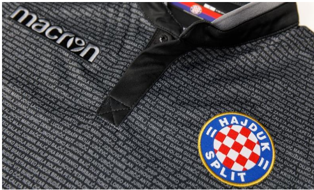
Slika 6: Treća garnitura dresa HNK Hajduk Split za sezonu 2017/2018.