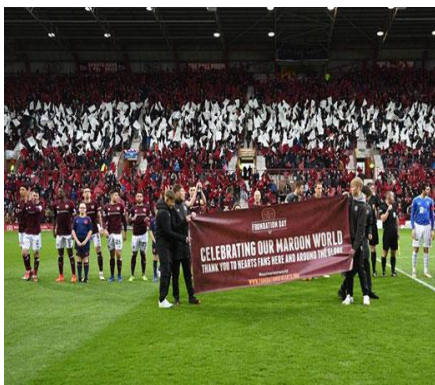
Slika 9: Ceremonija predstavljanja zaklade

Zaklada „The Foundation of Hearts“ je neprofitna organizacija koju je 2010. osnovala grupa lokalnih poslovnih ljudi, od kojih su svi dugogodišnji navijači kluba. Razlog osnivanja zaklade je zajednička i strastvena vizija za budućnost koja se temelji na vraćanju kluba ljudima koji ga vole i koji su zaslužni što je on onakav kakav je sad. Žele ga vratiti navijačima. Zakladi su se 2013. godine priključile sve podgrupe navijača (udruga dioničara, HYDC, Save our Hearts...). Potporu zakladi su pružili brojni političari, od lokalnih do onih u parlamentu sve u cilju unaprjeđenja vizije stjecanja vlasništva kluba.