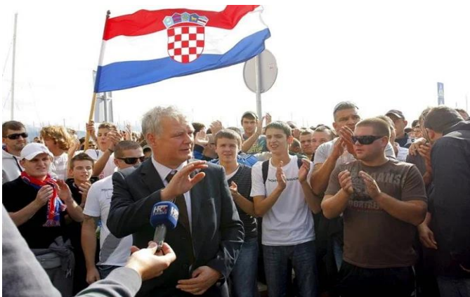
Slika 5: Torcida ispred Banovine, 12.10.2012.

nesavjesnim poslovanjem klub dolazi u financijsku krizu te nemaju sredstava za osnovne potrebe kao što je trening ili organizacija prvenstvenih utakmica. Vrijedni igrači napuštaju klub raskidom ugovora na koji imaju pravo zbog 3 mjeseca bez primljene plaće. Hajduk ostaje bez imovine i nalazi se na rubu propasti. Navijači i simpatizeri već tada kreću u akcije doniranja sredstava, tada ne znajući da se radi o počecima crowdfundinga u Hrvatskoj. Prvi potezi su početak učlanjivanja u klub te raspodjela sredstava od članarina preko udruge Naš Hajduk do računa HNK Hajduk koji će se služiti tim novcem za svoje poslovanje. Već u prvoj godini dolaze do respektabilnih cca. 8 tisuća članova. Brojka je dobra, ali nedovoljna. Hajduk je i dalje u problemima, ali navijači ne staju nego nastavljaju sa donacijama. Događaj koji je sve promijenio događa se 12.10.2012. kada Hajduku prijete bankrot jer Grad Split odbija izglasati jamstvo za kredit koji će klub održati na životu. Revoltirani navijači dolaze pred zgradu Banovine te vrše pritisak, mirnim prosvjedom, na gradske vijećnike. 3000 prisutnih navijača i simpatizera nakon iscrpne sjednice gradskog vijeća Grada Splita dobiva zadovoljštvu u izglasavanju davanja jamstva za kredit koji klub obećava vratiti u dogovorenom roku. 1920