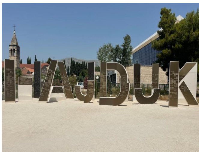
Slika 7: Idejno rješenje tematskog parka na Poljudu

1911. godine pa sve do danas. Izdavački dio ove monografije preuzela na sebe udruga Naš Hajduk, a na ovakav pothvat odlučila se tek nekolicina nogometnih klubova u svijetu. Ipak, glavna zahvala je ime donatora u tematskom parku posvećenom upravo njima, gdje će „za sva vremena“ biti upisani pored voljenoga kluba, tik uz glavni ulaz. Kao simbol ljubavi, tematski park krasit će imena preko 5.000 članova koji će ukupno, u obje navedene akcije donirati 7.500 kn ili više. U listopadu 2017. godine na tiskovnoj konferenciji udruga Naš Hajduk predstavila je detalje natječaja za idejno rješenje tematskog parka na Poljudu. Stručni žiri činili su predstavnici Hajduka i udruge Naš Hajduk dr. med. Ivan Rilov, tajnik Udruge Naš Hajduk; dipl. ing. geod. Slaven Marasović, predsjednik nadzornog odbora HNK Hajduk Split; dr.sc. Ivica Mitrović, Umjetnička akademija u Splitu; dipl. ing. arh. Tonči Čerina; povjesničar umjetnosti, ravnatelj Galerije Umjetnina Split Branko Franceschi; produkt dizajner, predsjednica Hrvatskog dizajnerskog društva (HDD) Maša Milovac; dipl. ing. arh. Dujam Ivanišević i dipl. ing. arh. Dragan Žuvela. 23 24