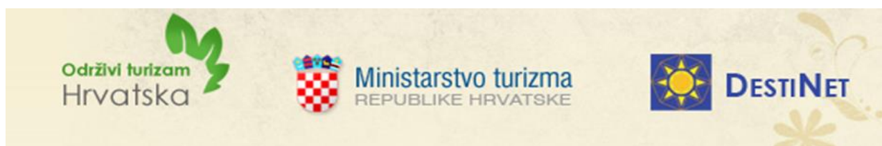
Slika 10. Naslovna stranica web portala „Održivi turizam Hrvatska“

Ministarstvo turizma posebnu važnost pridaje održivom razvoju hrvatskog turizma, što je vidljivo iz brojnih dosadašnjih aktivnosti i programa na području cijele Hrvatske, uz osobiti