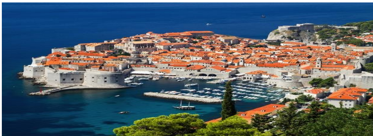
Slika 11. Grad Dubrovnik

kraju nalazi se Velika Onofrijeva česma, a na istočnom Mala Onofrijeva česma. Na Stradunu se ispred crkve sv. Vlahe nalazi se Orlandov stup, a to je kip legendarnog viteza Orlanda. To mjesto je davno služilo za čitanje obavijesti i proglašenja. Na trgu Luža nalazi se Gradski zvonik koji je visok 31 metar te je sagrađen 1444. Godine. 45, 46, 47