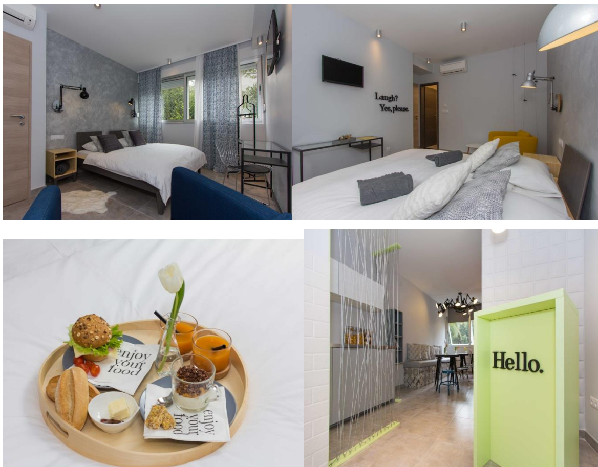
Slika 16. Bed and Breakfast Vibe, Split

72 zajednički prostor gdje se ujedno servira i doručak. Objekt je ekološki osviješten u gotovo svim pogledima, poput aktivnog recikliranja otpada, korištenja eko recikliranog papira u cijelom objektu, biorazgradivih detrdženata i šampona, za doručak je osmišljen jelovnik koji sadrži bezglutenske zalogaje te proteinske snackove. Dizajnerica interijera i voditeljica cjelokupnog projekta je ujedno i vlasnica objekta Melanija Meneghello. 73