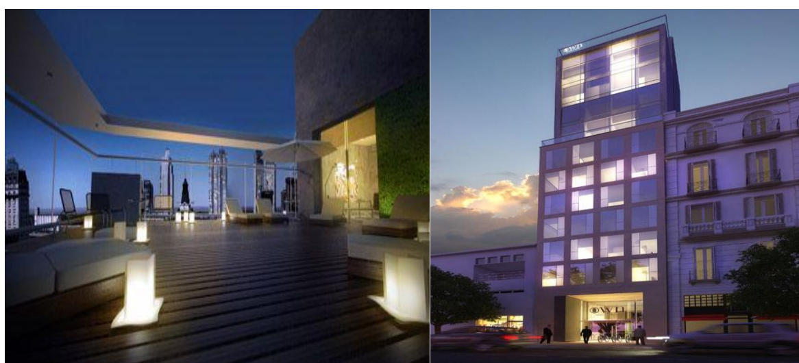
Slika 8.i 9. Hotel Palo Alto, Buenos Aires, Argentina 37

U stražnjem dijelu hotela smješten je 20 metarski vodopad koji prikuplja kišnicu za navodnjavanje te skriveni vrt ispunjava mirisima i zvukovima prirode. Osim podova koji su napravljeni od lokalnog drveta, svi tekstili korišteni u hotelu također su lokalno proizvedeni bez korištenja štetnih kemikalija, a činjenica da je svaki balkon uronjen u zelenilo gostima ovog višemilijunskog užurbanog grada osiguran je miran i spokojan odmor. 36