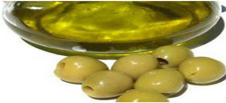
Slika 13. Masline i maslinovo ulje 63