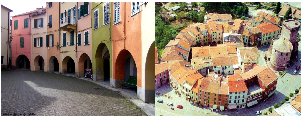
Slika 6.i 7. Grad Varese Ligure, Italija

Mali talijanski gradić Varese Ligure u provinciji La spezia postao je održiva turistička destinacija poznata po svojoj ekološkoj proizvodnji, u potpunosti temeljenoj na održivim izvorima energije. Kada se 1980.-ih našao na samom rubu zbog propasti industrije, što je rezultiralo drastičnim smanjenjem broja stanovnika, gradske su se vlasti odlučile na rehabilitaciju poljoprivrednog sektora i zaštitu okoliša čime su u konačnici spasile grad. Početkom 1990.-ih stvorili su drugačiji obrazovni sustav, koji je pomogao izgradnji zajednice kako djece, tako i odraslih, s dugoročno održivim vrijednostima u budućnosti. Sada 108