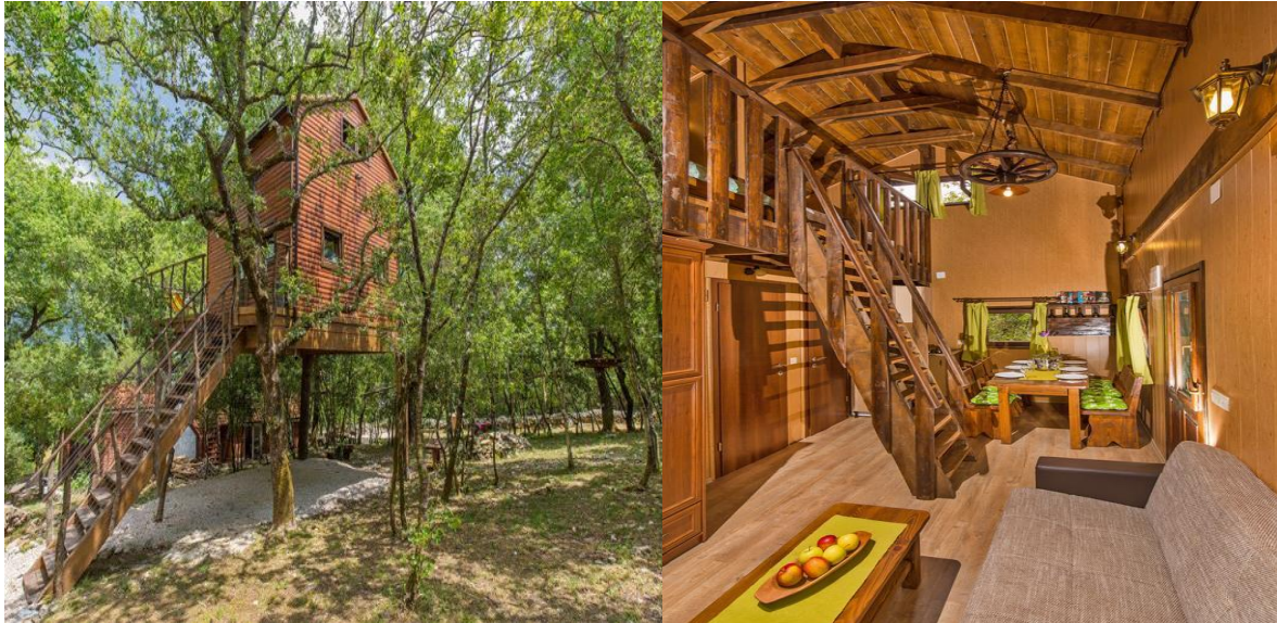
Slika 12. Treehouse, Konavle 61