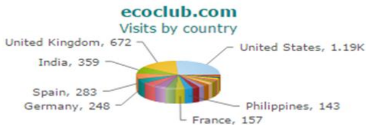
Slika 4. Analitika posjeta web portalu Ecoclub.com u posljednjih 30 dana po državama