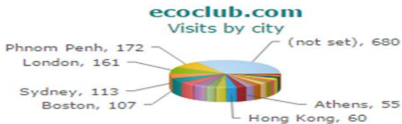
Slika 3. Analitika posjeta web portalu Ecoclub.com u posljednjih 30 dana po gradovima

Ecoclub je globalna mreža sačinjena od pojedinaca- praktičara, akademika, studenata i putnika, kojim koordinira tim iz Atene, a kao glavni cilj organizacije ističu se napori za očuvanje okoliša i promicanje eko turizma što nije jednostavno uzevši u obzir trenutačnu globalnu i socioekonomsku krizu. U organizaciji smatraju kako su sloboda i solidarnost ključni čimbenici budućeg napretka čovječanstva. Njihov je način rada istodobno znanstveni i humanistički, s izraženim naporima za očuvanje i unaprjeđenje okoliša, uz što manje sukoba i stigmatizacije.