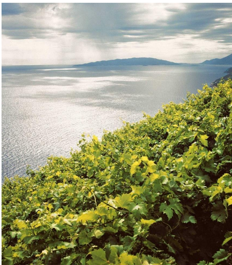
Slika 3 Trstenik Vinogorje Pelješac

uvijek je, kao i danas, karakterizirao nedostatak značajnijih industrijskih pogona. 33 100-tinjak stanovnika mjesta Trstenik bavi se uglavnom vinogradarstvom, maslinarstvom, turizmom i ribarstvom. Mjesto je poznato po vinarstvu. Valja naglasiti da se Trstenik nalazi unutar zaštićenog područja ZOI „Dingač“, koje ukupno zauzima tek 7,58 km 2 te obuhvaća još i naselja Pijavičino, Podobuče i Potomje.