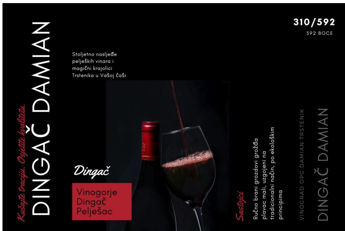
Slika 4 Etiketa za boce vina, proizvod OPG-a