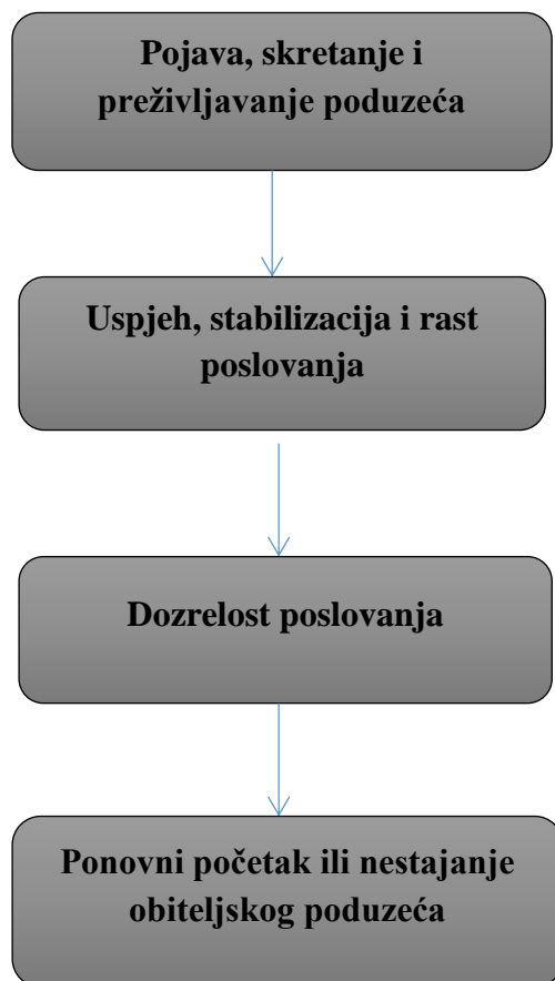
Slika 1: Prikaz životnog ciklusa obiteljskog poduzeća

Ponovni početak ili nestajanje obiteljskog poduzeća - U ovoj fazi uočavamo slabljenje konkurentske pozicije poduzeće, pad poslovnih performansi i smanjenje mogućnosti za poslovni preokret. Moguća rješenja: nestajanje ( likvidacija poduzeća sa slabim performansama) i ponovni početak ( jačanje pozicije kroz pokretanje novih projekata i inicijativa u okviru postojećeg poduzeća )