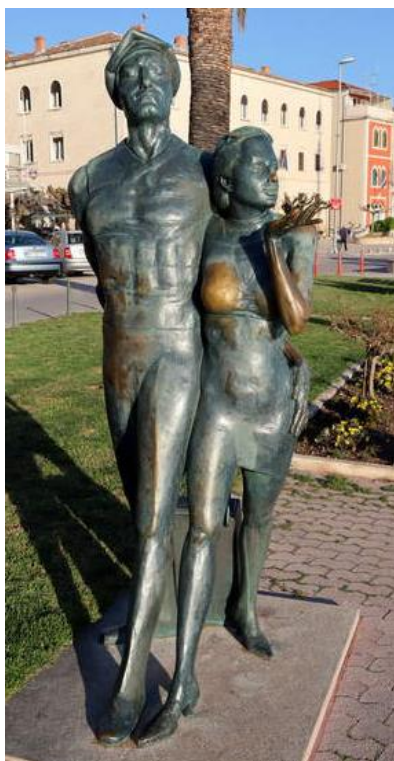
Slika 3: Spomenik turistu (obljernica stogodišnjeg turizma)

Najveći broj gostiju dolazi iz Njemačke (23037), slijede ih Česi (22231), zatim redom Austrija (12554), Italija (5216), Francuska (4590) i Velika Britanija (3792). Najmanje posjetitelja dolazi iz Turske (21), Rumunjske (37), Finske (48) i Grčke (51).