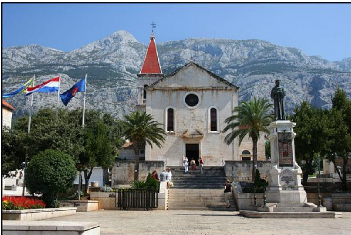
Slika 6: Kačićev Trg i Crkva Sv. Marka