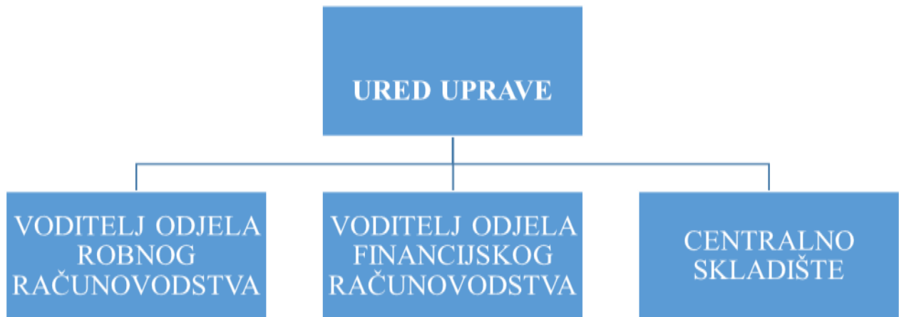
Slika br. 1.: Organizacijska struktura poduzeća Nird d.o.o., Kaštel Lukšić