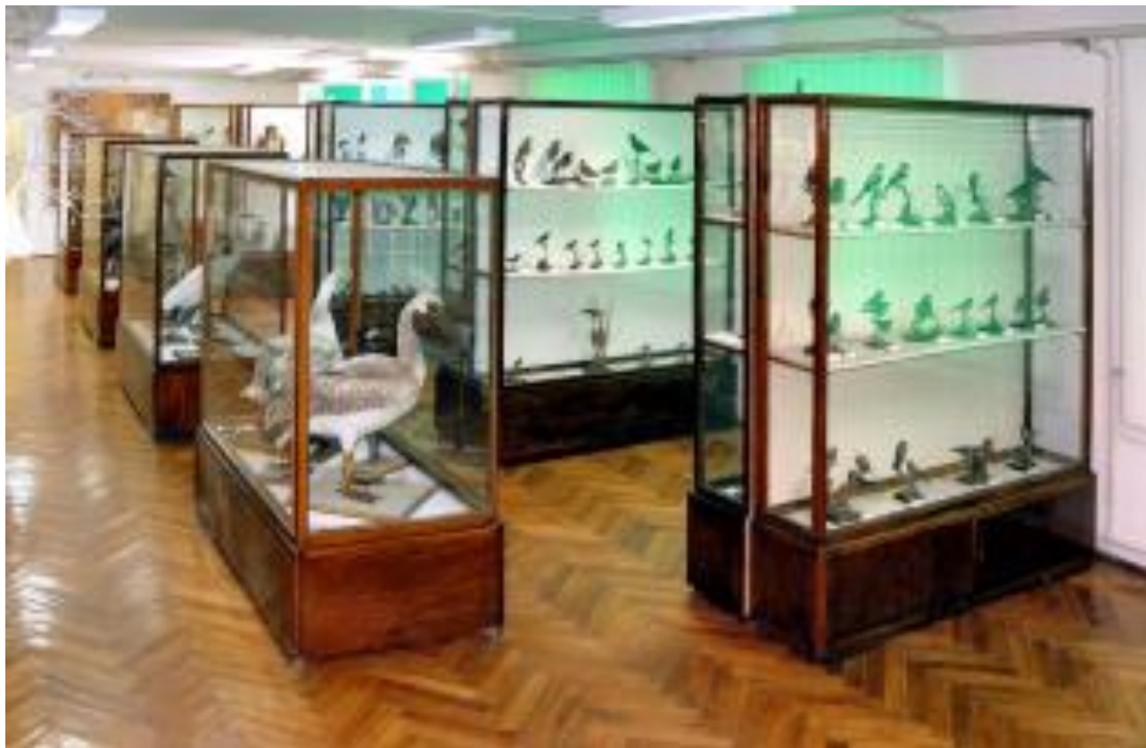
Slika 11. Ornitološka zbirka u Metkoviću, pristup: 23.8.2023. https://hr.wikipedia.org/wiki/Ornitolo%C5%A1ka_zbirka_u_Metkovi%C4%87u

Kada se govori o vrstama turizma, seoski je turizam najidealniji e za razvoj u neretvanskom području. Kako bi se on razvijao potrebno je stalno poticati sređivanje okućnica te svih komunalnih sadržaja. Za razvoj seoskog turizma nužno je raditi na unapređenju određenih ugostiteljskih ponuda i lokalnih namirnica (mandarine i sl.).