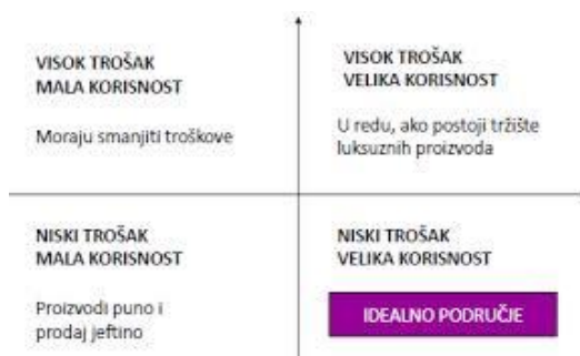
Slika 1: Odnos troškova i koristi

Pri određivanju cijene potrebno je voditi računa o odnosu troškova i koristi proizvoda. Primarni cilj predstavlja pozicija u području visoke koristi i niskih troškova.