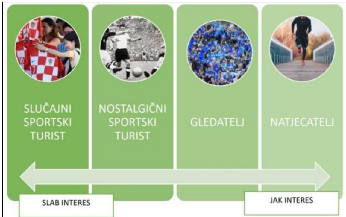
Slika 1. Raspored korisnika usluga športskog turizma prema intezitetu (Jovanović 2022)