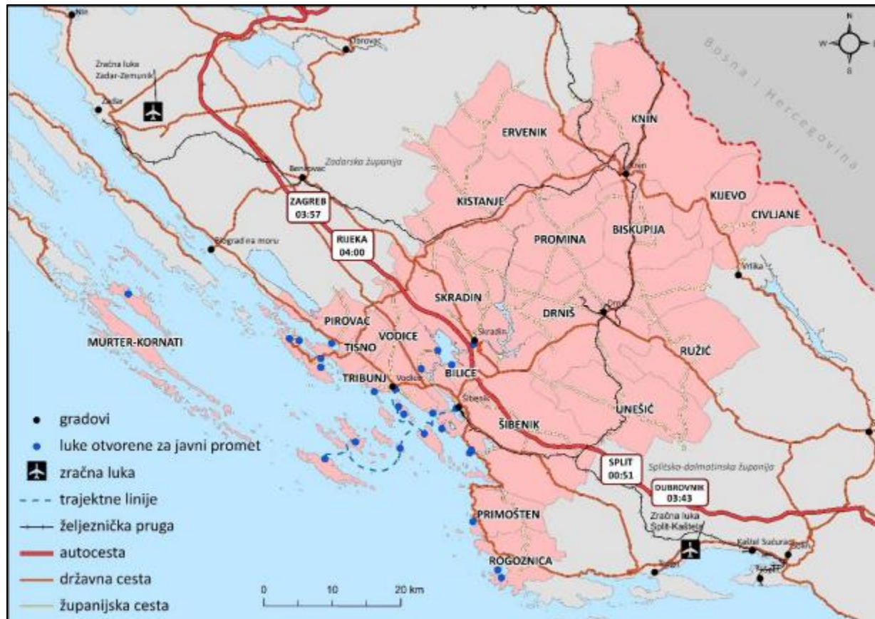
Slika 7. Prometni sustav Šibensko-kninske županije