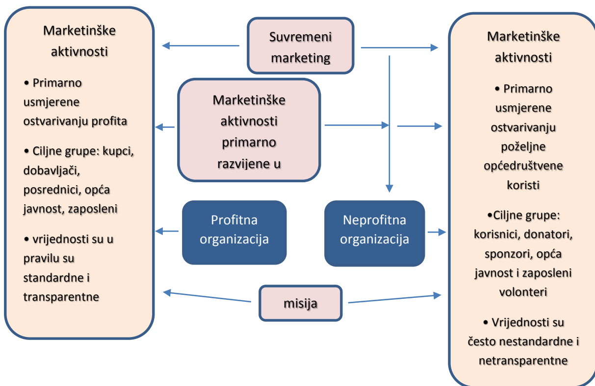
Slika 1. Specifičnosti marketinga profitnih i neprofitnih organizacija