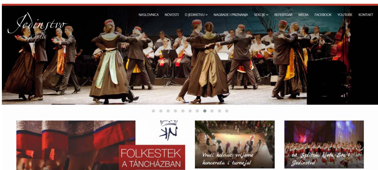
Slika 4. Internet stranica KUD Jedinstva