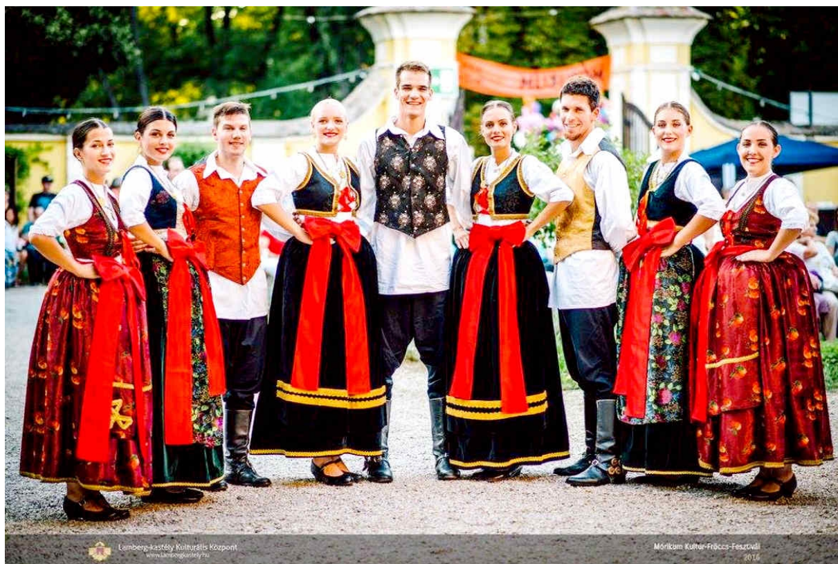
Slika 5. Prikaz nošnje KUD-a Jedinstvo