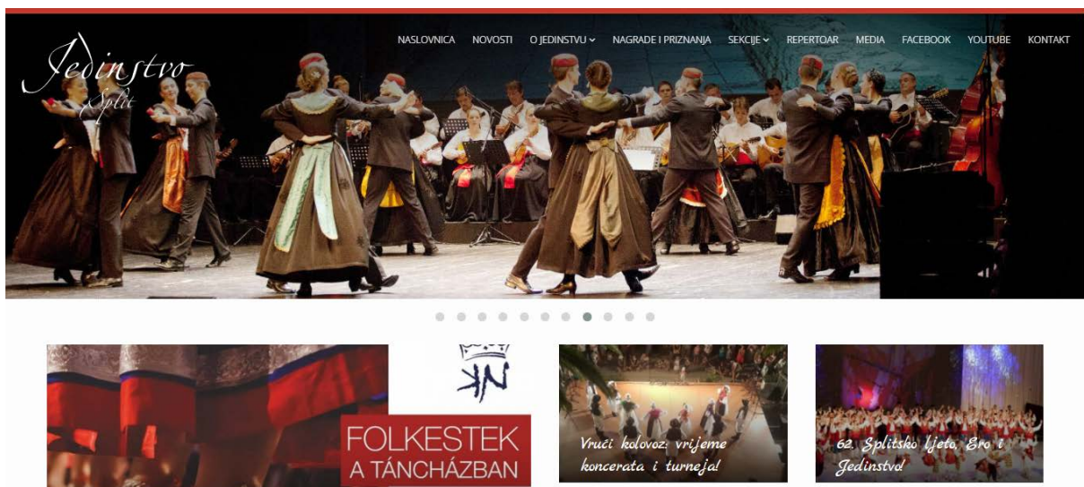
Slika 4. Internet stranica KUD Jedinstva