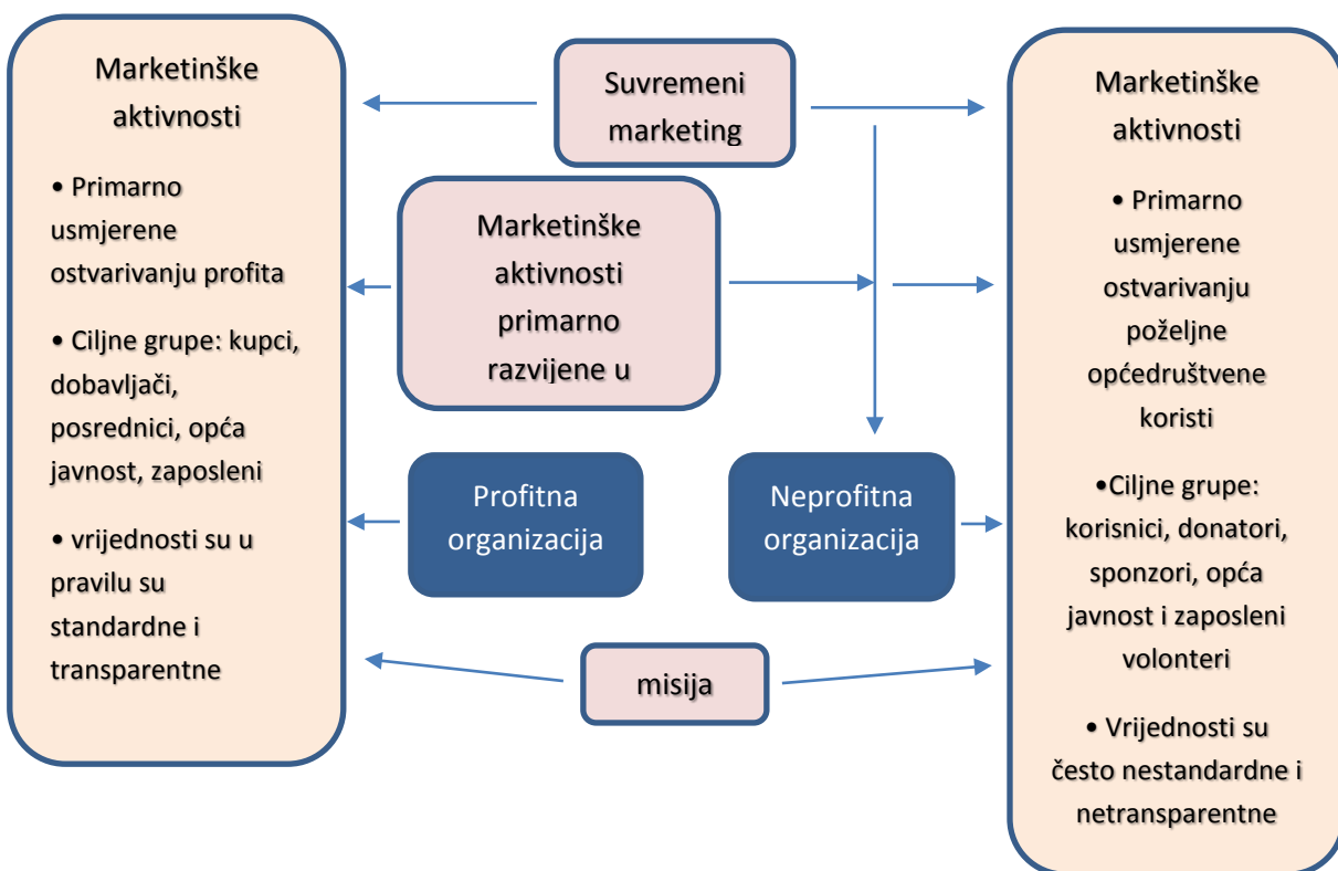
Slika 1. Specifičnosti marketinga profitnih i neprofitnih organizacija