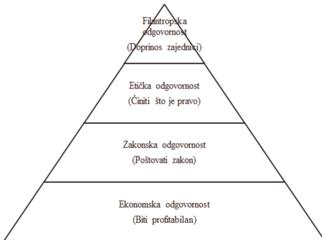
Slika 1: Carollova piramida (vrste društvene odgovornosti)