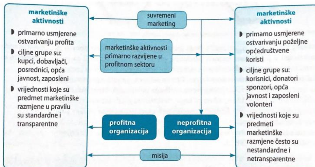
Slika 2: Pojediniosti marketinga profitnih i neprofitnih organizacija