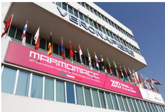
Slika 2: Ulaz na sajam MARMOMACC

Na sajmu u Veroni izlagači iz Hrvatske često dobivaju prezentacije unutar službenih događanja na sajmu. Najzapaženiji uspjeh naši izlagači imali su 2012. godine kada je u sklopu sajma održana prezentacija projekta „Kamen“. Projekt je osim izlagača iz Hrvatske okupio i izlagače iz Bosne i Hercegovine, kao zajednički projekt potpomognut sredstvima IPA programa prekogranične suradnje iz EU fondova. Cilj projekta bio je doprinos razvoju prekograničnog gospodarstva na području Dalmacije i Hercegovine, a sve kroz razvoj gospodarstva u sektoru eksploatacije i obrade kamena. Kroz ovaj projekt popularizirala se obrada kamena i tradicionalno kamenoklesarstvo, kao profitabilna grana gospodarstva, jačanje suradnje kod poduzetnika, a sve s ciljem rasta i bolje konkurentnosti na tržištu. Jedan od specifičnosti projekta je unapređenje kapaciteta i poboljšanje dostupnosti usluga na cijelom području.