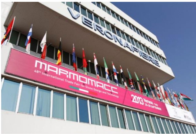
Slika 2: Ulaz na sajam MARMOMACC

Na sajmu u Veroni izlagači iz Hrvatske često dobivaju prezentacije unutar službenih događanja na sajmu. Najzapaženiji uspjeh naši izlagači imali su 2012. godine kada je u sklopu sajma održana prezentacija projekta „Kamen“. Projekt je osim izlagača iz Hrvatske okupio i izlagače iz Bosne i Hercegovine, kao zajednički projekt potpomognut sredstvima IPA programa prekogranične suradnje iz EU fondova. Cilj projekta bio je doprinos razvoju prekograničnog gospodarstva na području Dalmacije i Hercegovine, a sve kroz razvoj gospodarstva u sektoru eksploatacije i obrade kamena. Kroz ovaj projekt popularizirala se obrada kamena i tradicionalno kamenoklesarstvo, kao profitabilna grana gospodarstva, jačanje suradnje kod poduzetnika, a sve s ciljem rasta i bolje konkurentnosti na tržištu. Jedan od specifičnosti projekta je unapređenje kapaciteta i poboljšanje dostupnosti usluga na cijelom području.