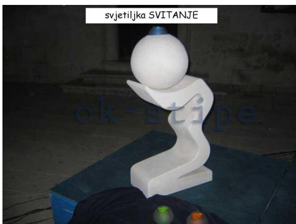
Slika 10: Svjetiljka Svitanje