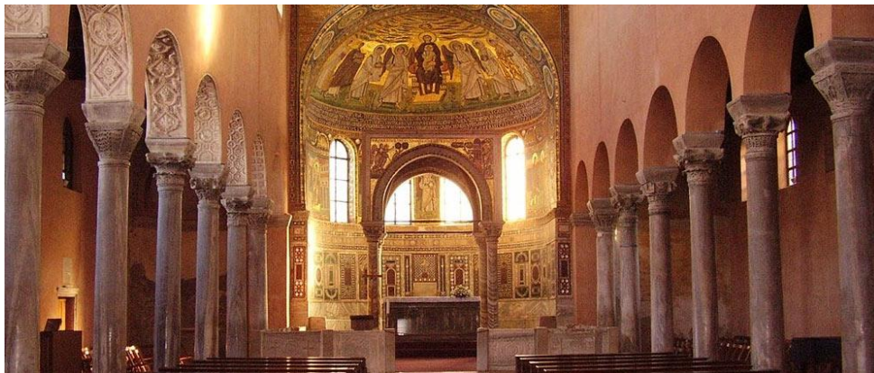
Slika 7: Ranokršćanski kompleks Eufrazijeve bazilike u Poreču