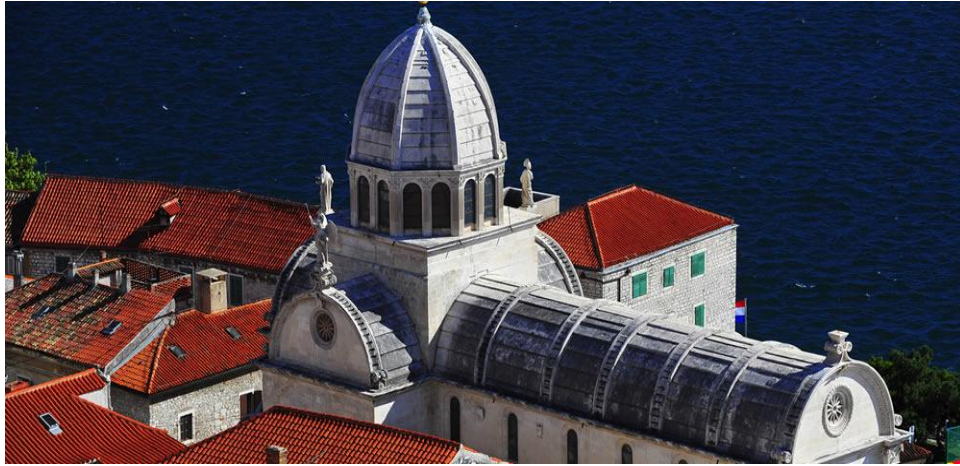
Slika 5: Katedrala Sv. Jakova u Šibeniku