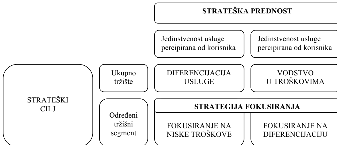
Slika 1: Tri generičke konkurentske strategije u upravljanju uslugama

Izvor: Prilagođeno prema Renko, N., Strategije marketinga , Ljevak, Zagreb, 2009., str. 276