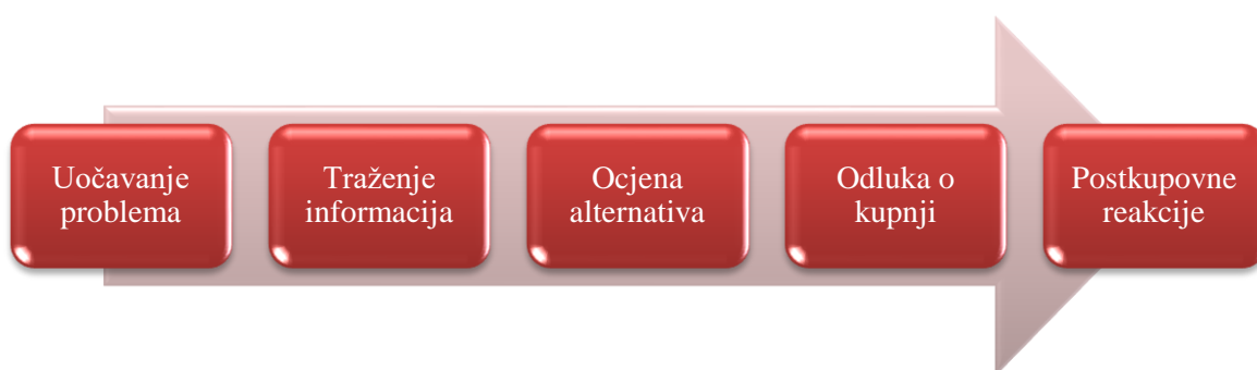
Slika 4. Proces donošenja odluke o kupovini

Proces donošenja odluke o kupnji je proces kroz koji prolaze osobe koje su odlučile kupovati neki proizvod/uslugu, a taj je proces pod utjecajem mnogih čimbenika i marketinških aktivnosti poduzetničkog subjekta (Grbac i Meler, 2007).