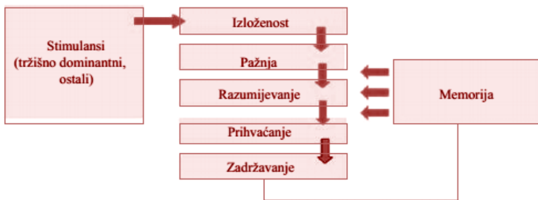
Slika 2. Proces prerade informacija

Prema Kesić (2006) prerada informacija je početna faza u procesu donošenja odluke u kupnji i stoga je od izuzetnog značaja za strategiju promotivnih aktivnosti. Prerada informacija prolazi kroz nekoliko faza kako je prikazano na slici 2.