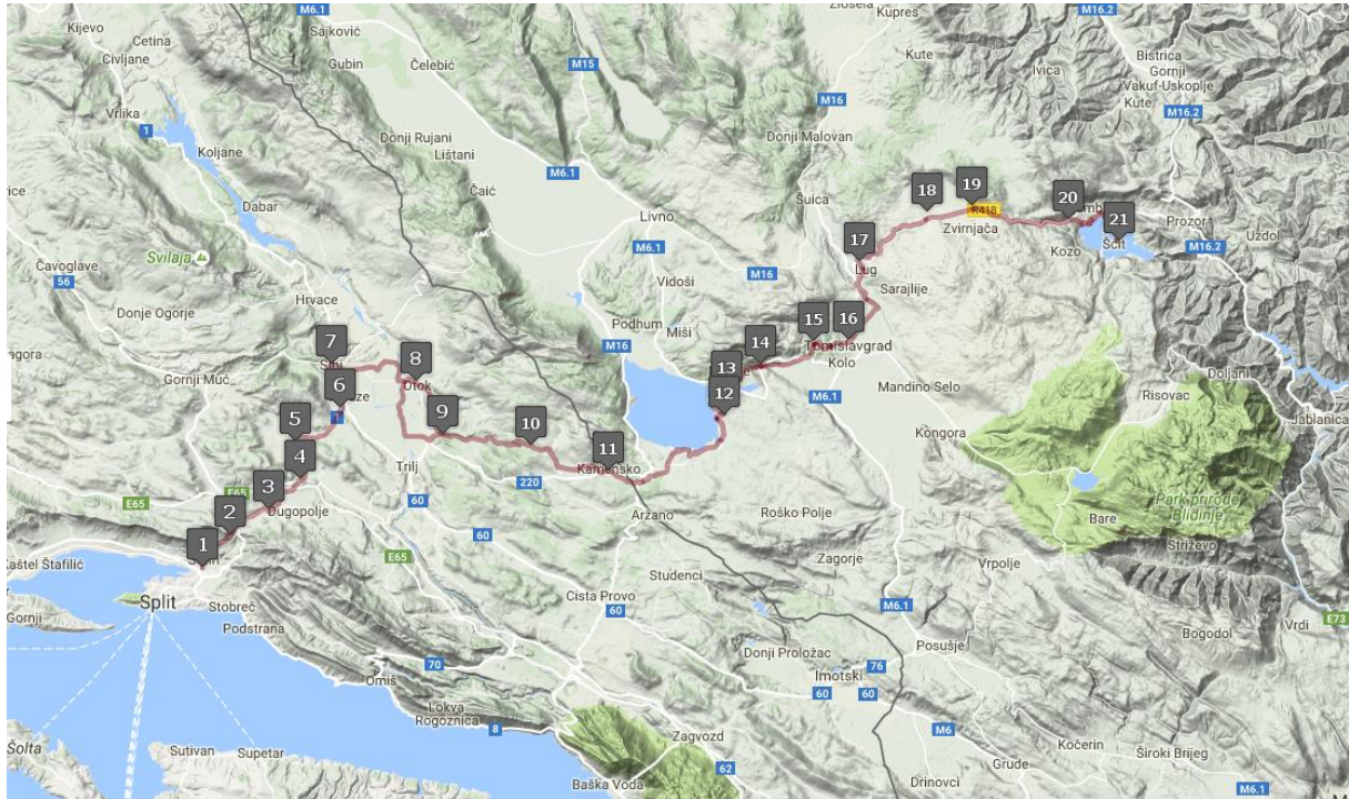
Slika 1. Karta projekta "Staza Gospi Sinjskoj"