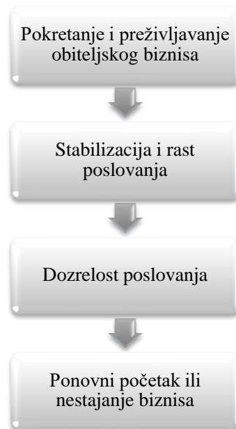
Slika 2. Prikaz životnog ciklusa obiteljskog poduzeća

Svako poduzeće, kao i živi organizam, ima svoj životni ciklus, odnosno unaprijed određenu putanju u svom razvojnem putu. U svom razvoju, poduzeće ima različitu razvijenost fleksibilnosti i samokontrole. Faze životnog ciklusa su vrlo često različito prikazivane ovisno o autoru ali im je ipak suština ista. Kao i druge oblici poduzeća, obiteljska poduzeća prolaze kroz svoj životni vijek kroz nekoliko faza kako je prikazano na slici 2.