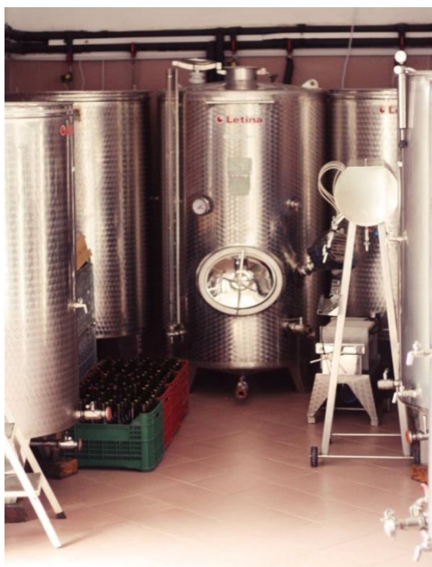
Slika 4. Vinski podrum

Kako je s godinama rastao obim proizvodnje tako je bio potreban i napredak u mehanizaciji proizvodnje vina.