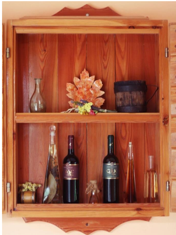
Slika 3. Proizvodni asortiman vinarije "Popić"

Obiteljsko gospodarstvo Cebalo-Popić osim svog čuvenog grka proizvodi još i kvalitetno maslinovo ulje, domaće likere od višnje, limuna i oraha te travaricu.