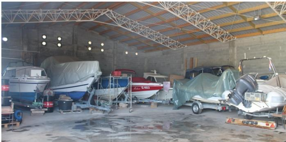
Slika 4: Prikaz unutarjosti suhe marine u kojoj se mogu vršiti popravci