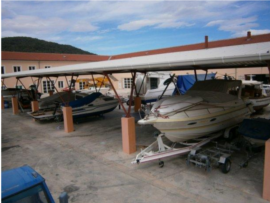
Slika 2: Prikaz suhe marine