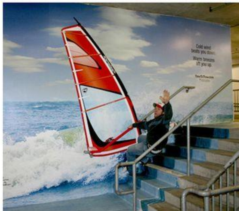
Slika 10: Gerilski marketing u turizmu – Južna Karolina