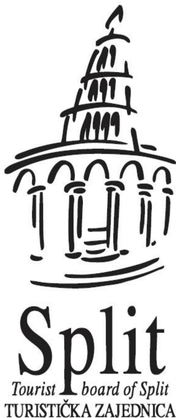
Slika 19: Logo turističke zajednice grada Splita

Izvor: http://heraznanje.com/split-ima-sto-nitko-nema-sto-koluri-jednog-ljeta/ ; preuzeto [01.09.2016.]