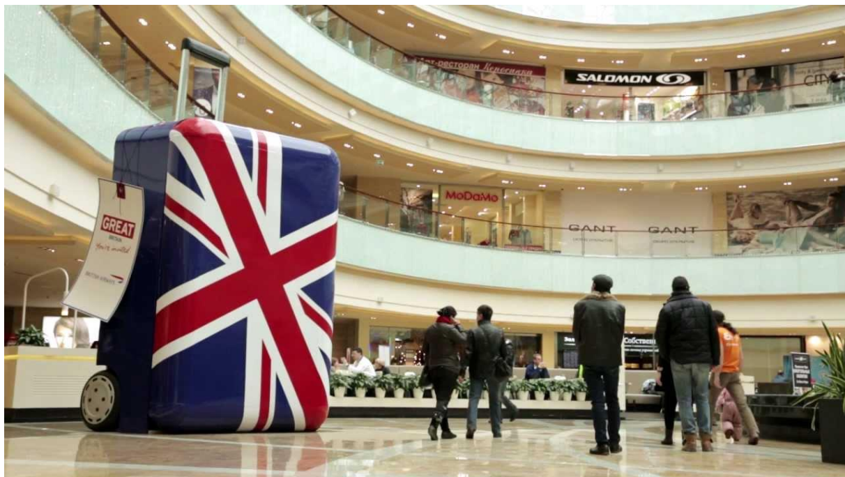
Slika 15: Kovčeg u trgovačkom centru u Moskvi

Tako možemo prepoznati James Bonda, Marry Poppins, kraljicu Elizabetu, Beatlese i ostale kako ulaze u kovčeg. 109