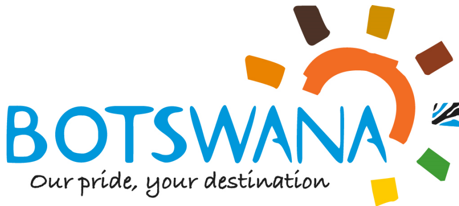
Slika 2: Znak (brand mark) marke

Znak odnosno brand mark koristi se kako bi se što jasnije i preciznije definiralo što predstavlja marka, koji proizvod, uslugu, koja mu je namjena i kako ga koristiti. 28