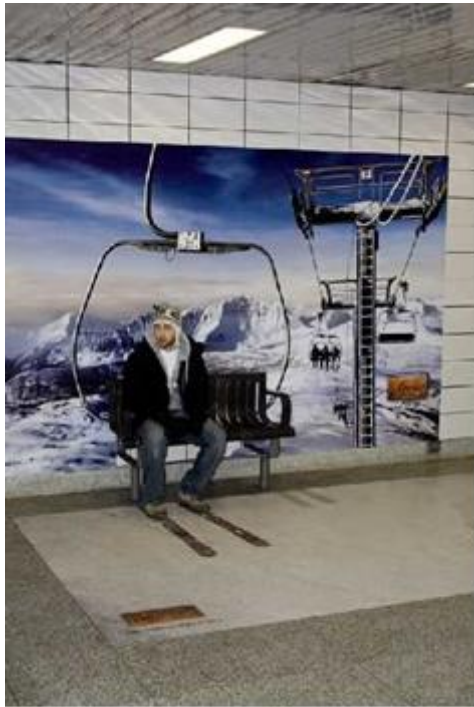
Slika 11: Gerila marketing u turizmu