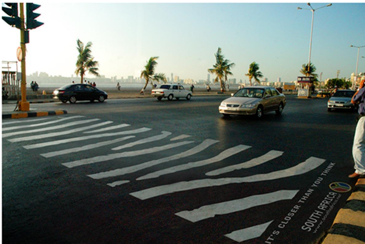
Slika 8: Gerilski marketing-promoviranje turizma u Južnoj Africi

Popularnosti gerila marketinga u velikoj je mjeri pridonio Internet. U tom smislu može se zaključiti da današnja internetska tehnologija svim tvrtkama, neovisno o tome jesu li one velike ili male, pruža priliku da se nadmeću u ujednačenim uvjetima. 95