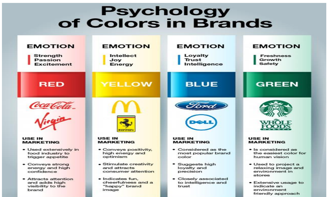
Slika 3: Važnost boja za marketing

Boje nekog logotipa su moćnije od samog logotipa. Boja može postati ključni dio bilo koje marke, bilo da je boja logotipa crvena i intenzivna, žuta i radosna ili crna i tajanstvena, ona kupcu nešto sugerira. 32