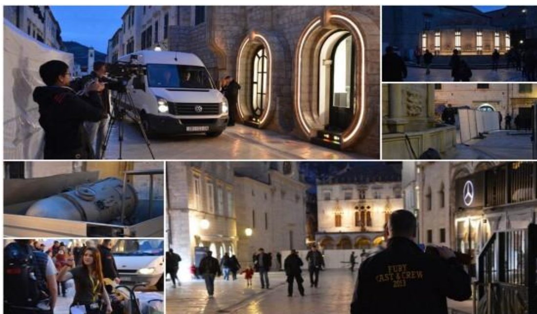
Slika 20: Snimanje filma Star Wars u Dubrovniku

Omiš se može diferencirati od drugih destinacija jer je spoj odmorišnog i avanturističkog, te kulturnog turizma i udovoljava interesima različitih dobnih skupina i to je ono na što se baziraju u turističkoj zajednici grada Omiša.