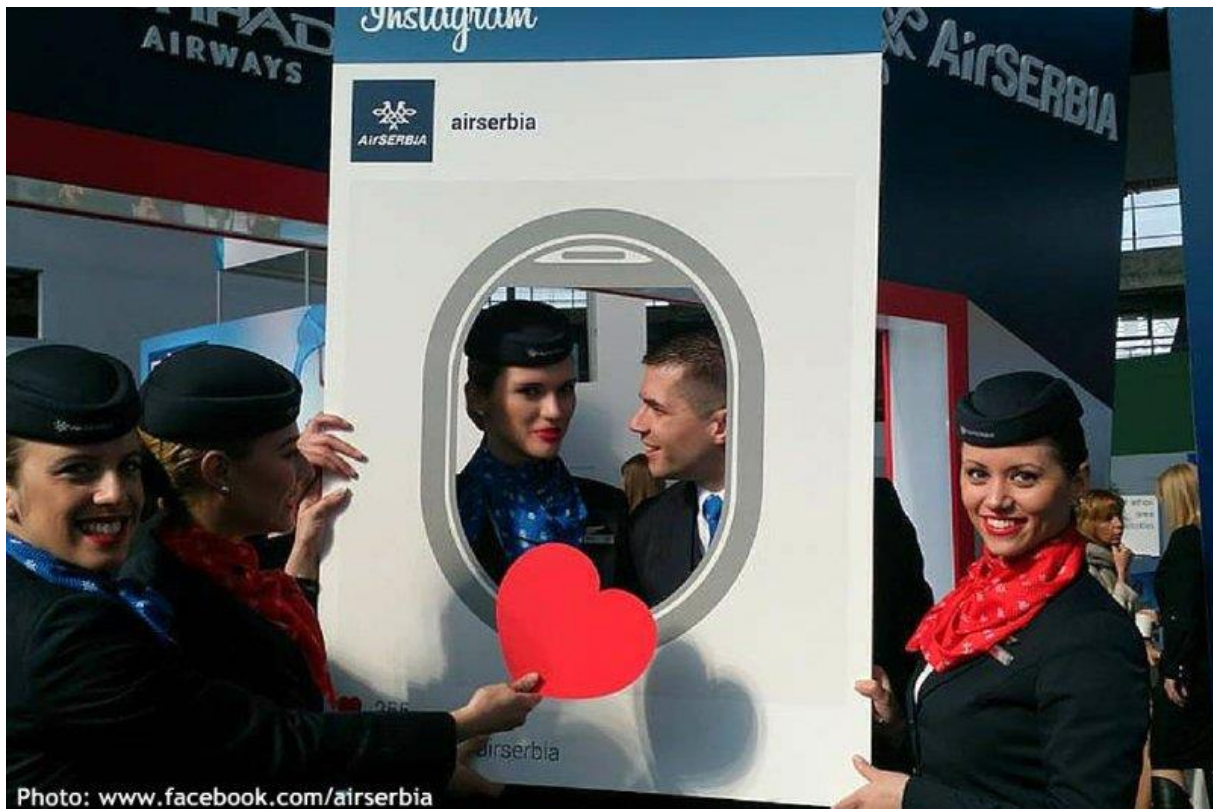
Slika 7: Air Serbia i promoviranje njihovog Instagram profila