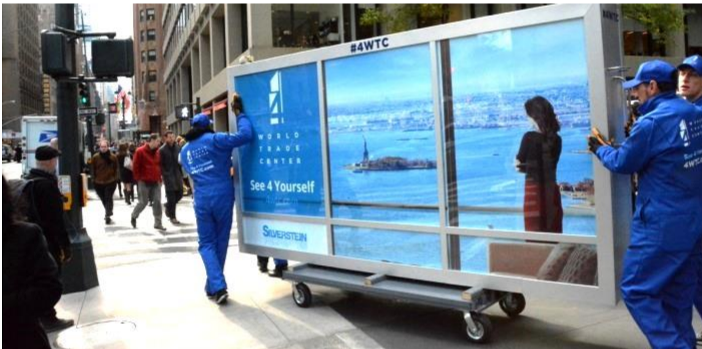
Slika 12 : Gerila marketing u turizmu-Mobilna oglasna tabla, New York City