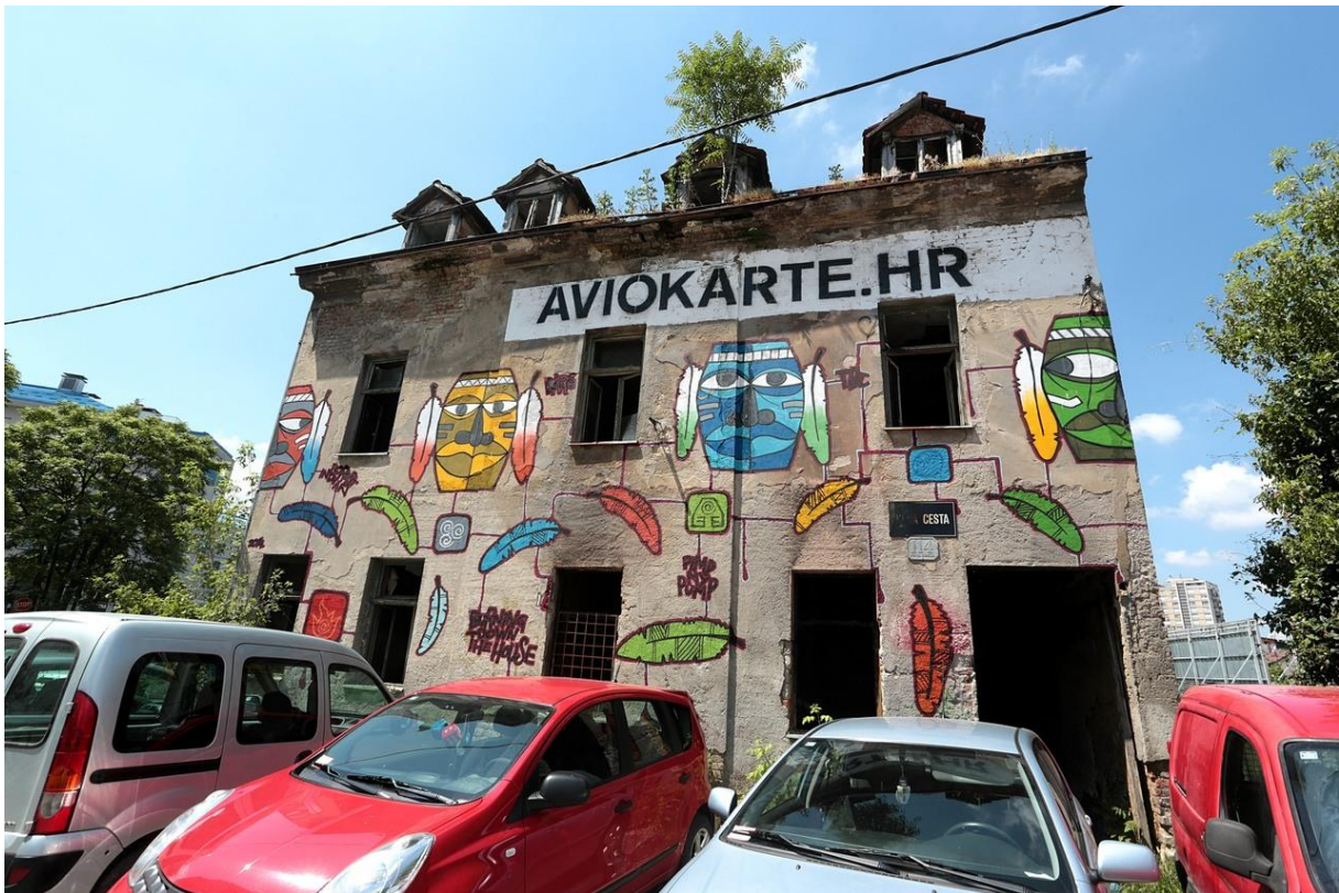
Slika 18: Reklama Aviokate.hr-a

Tako da je prva prava kampanja gerilskog marketinga u Hrvatskoj poprimila negativne konotacije. 112