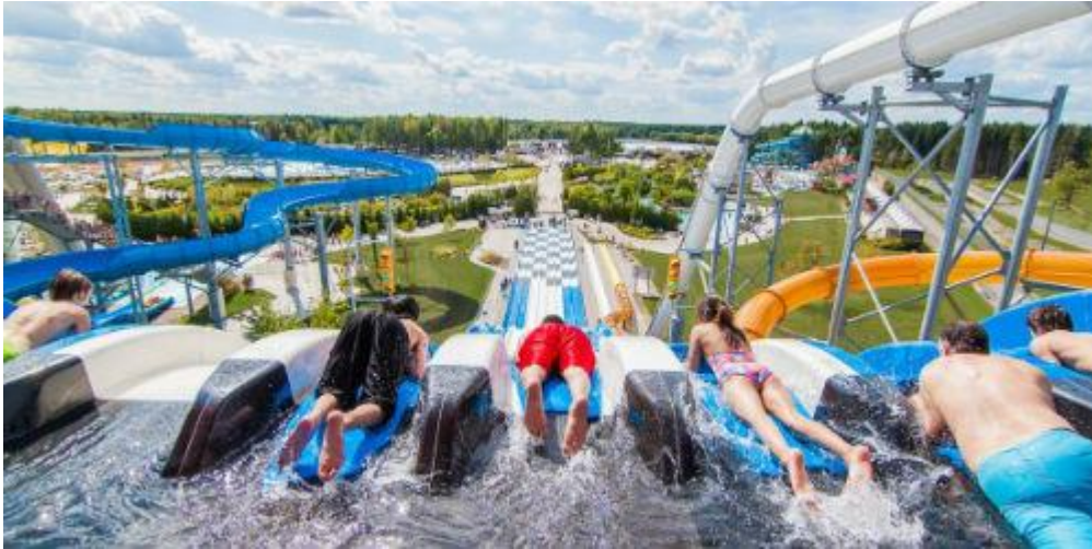
Slika 16: Vodeni park u Vancouveru