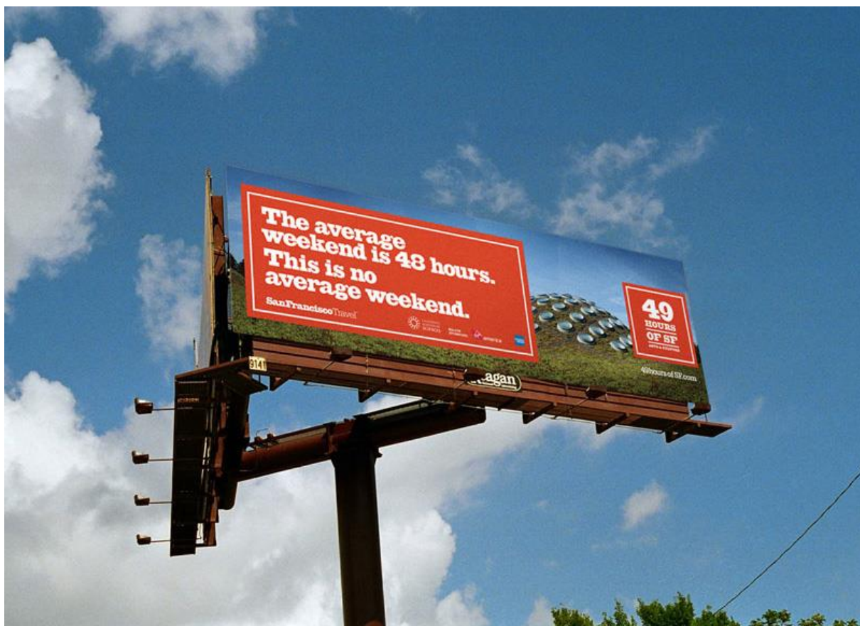
Slika 17: Jumbo plakat za "49 hours for SF"

Izvor: http://naparfp.teaklabs.com/ ; preuzeto [01.09.2016.]