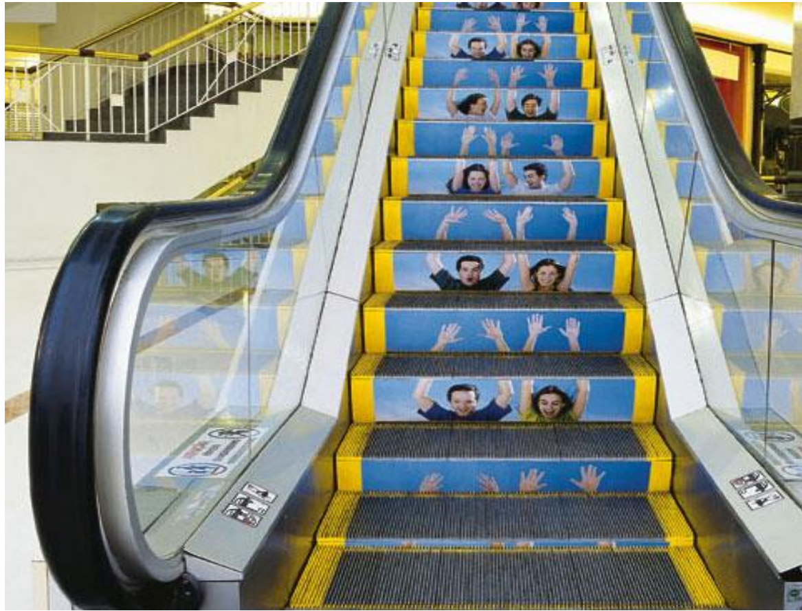
Slika 9: Gerilski marketing – oglašavanje zabavnog parka HopiHari Theme u Brazilu