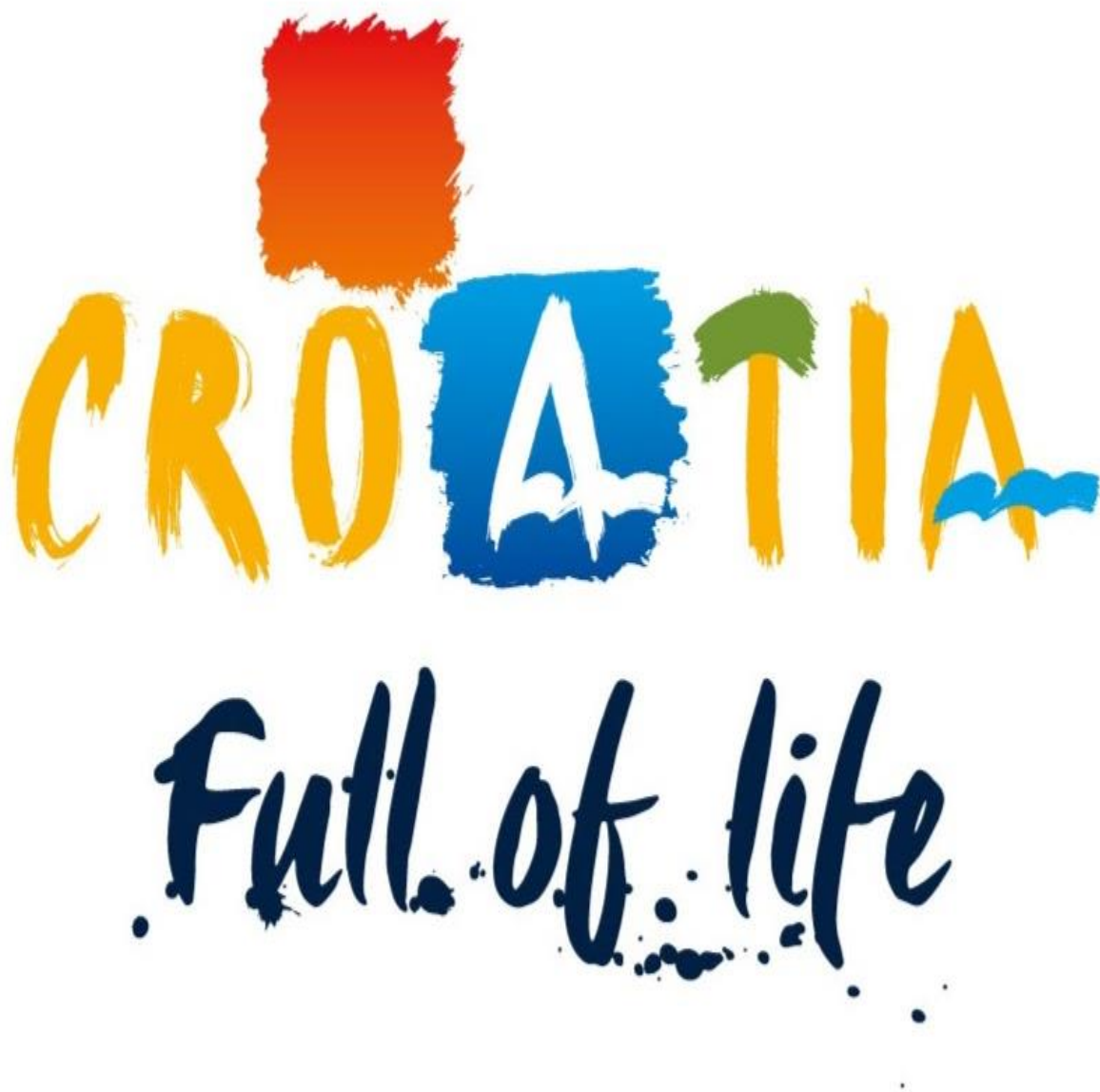
Slika 5: Logo hrvatskog turizma

Izvor: https://plus.google.com/photos/+CroatiaHr/albums/5791674534590042881 ; preuzeto [01.12.2016.]