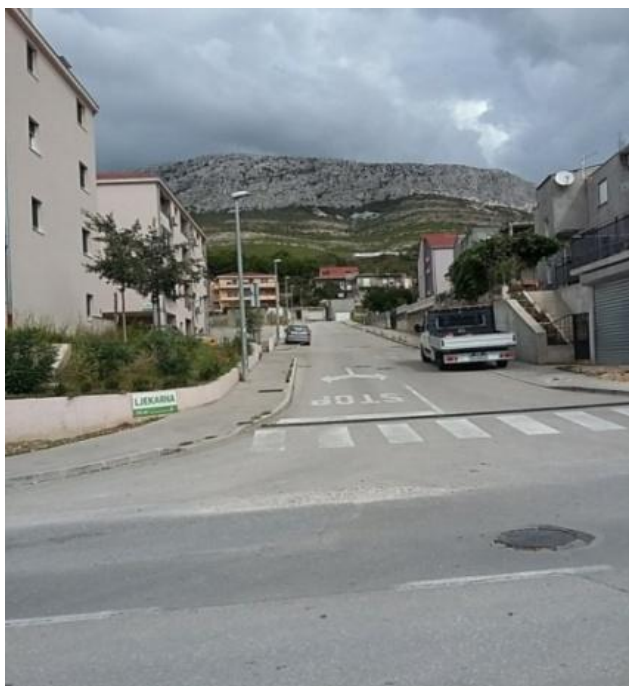
Slika 3. Prometnica „Ispod Gašpini 2“