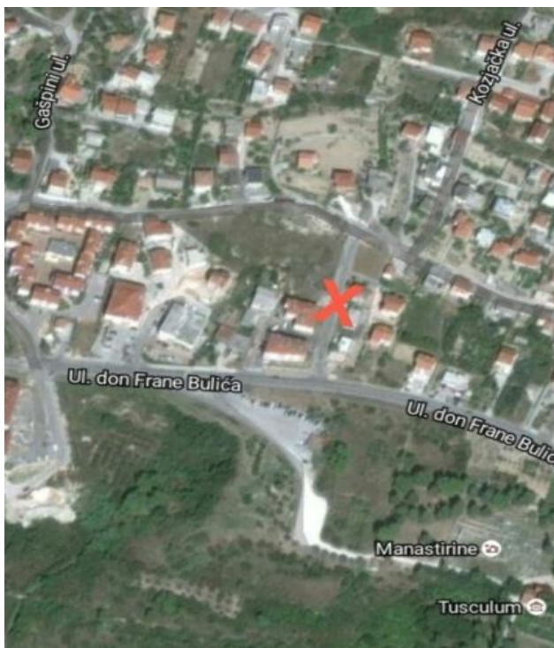
Slika 2. Satelitski prikaz mjesta izgradnje prometnice „Ispod Gašpini 2“

Dakle, u realizaciji ovoga projekta sudjelovali su Grad Solin kao javni partner po zastupništvu tadašnjeg gradonačelnika grada Solina Blaženka Bobana i privatni partner-tvrtka Dolić-Pivac građenje d.o.o. koju je zastupala direktorica Marina Maretić. Ove stranke, dana 7. lipnja 2013. godine, sporazumno su sklopile ugovor o uređenju međusobnih prava i obveza glede izgradnje II. faze prometnice koja se gradi na parceli br. 26 unutar obuhvata DPU-a „Ispod Gašpini 2“. Detalji ugovora nalaze se u prilogu diplomskog rada. Slike 2 i 3 prikazuju mjesto izgradnje prometnice „Ispod Gašpini 2“.