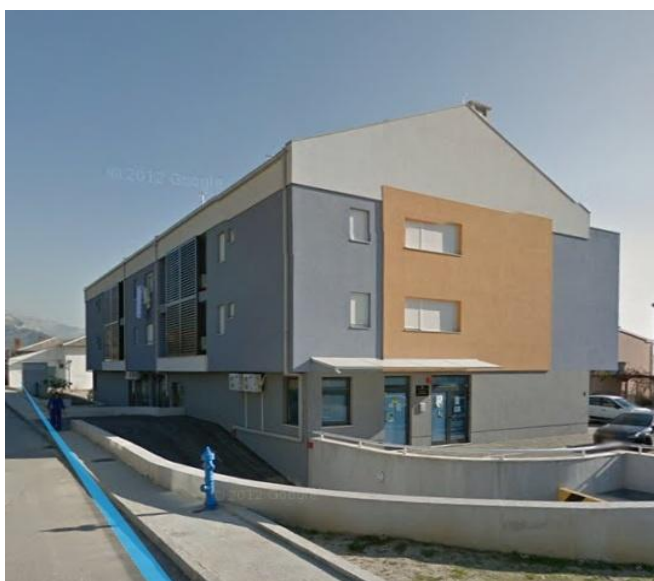
Slika 5. Stambeno-poslovna zgrada u Svetom Kaju