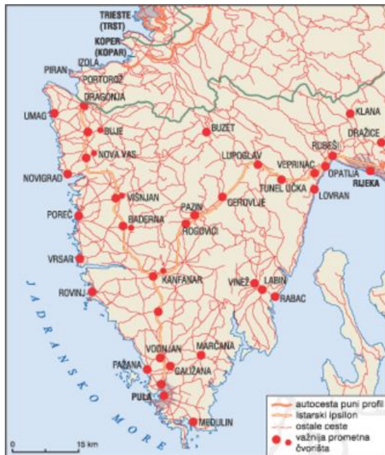
Slika 3. Ceste Istre