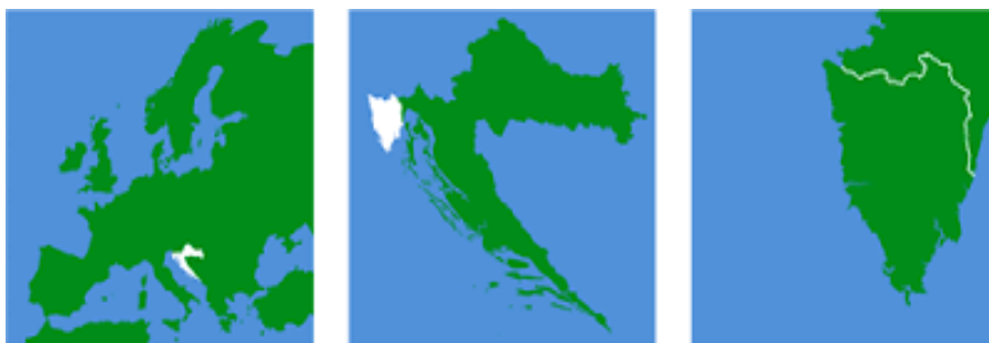
Slika 2: Položaj Hrvatske u Europi, položaj Istre u Hrvatskoj i izgled poluotoka Istre

Slikom 2. prikazan je položaj Hrvatske u Europi, položaj Istre u Hrvatskoj te izgled poluotoka Istre.