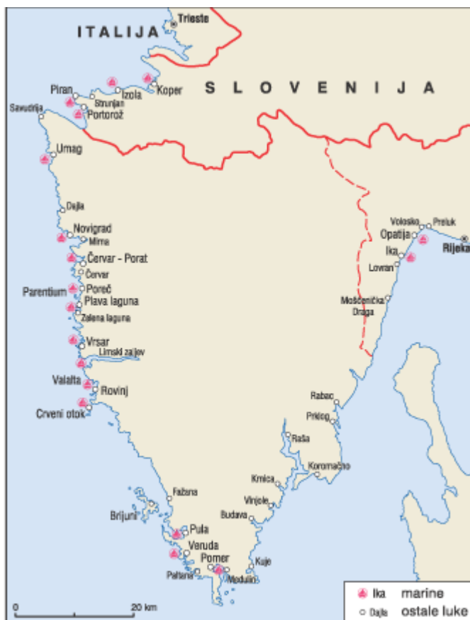
Slika 4. Luke i marine Istre

Na Slici 4. prikazana je karta Istre sa lukama i marinama.