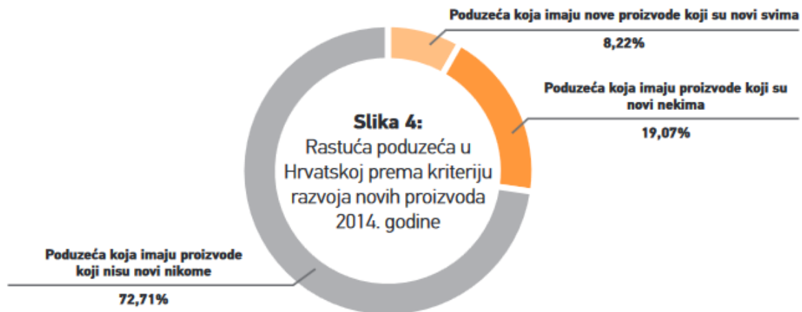
Slika 4. Rastuća poduzeća u Hrvatskoj prema kriteriju razvoja novih proizvoda 2014. godine