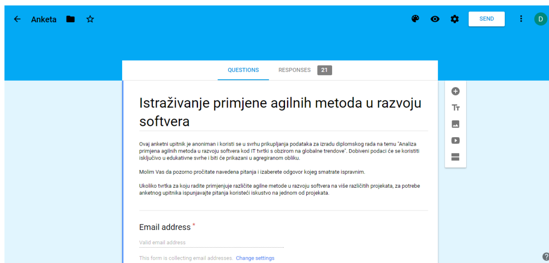
Slika 1: Google Forms sučelje za uređivanje anketnih pitanja

Slika 1 prikazuje Google Forms sučelje za uređivanje anketnih pitanja.