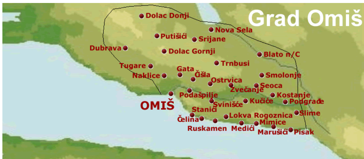
Slika 3 : Područje grada Omiša i naselja pod upravom grada Omiša

Grad Omiš je malen dalmatinski grad, smješten na ušću rijeke Cetine, 25 km južno od Splita. S površinom od 266 km 2 , područje grada Omiša graniči sa šest općina – Dugi rat, Dugopolje, Trilj, Cista Provo, Šestanovac i Zadvarje. U službenom sastavu Grada definirano je, osim starog grada, trideset (30) naselja, a područje priobalja od zaobalnog područja dijeli planinski lanac - Poljička planina, Mosor i Omiška Dinara. Cjelokupan prostor grada podijeljen je vizualno planinom na dva područja, ali se funkcionalno grad dijeli na tri različite cjeline: Zagora i Poljica, stari grad Omiš i Rivijera koja se proteže na više od 20 km. 26