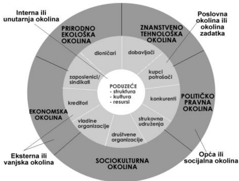
Slika 1. Struktura okoline poduzeća

Uspješnost poduzeća uvelike je određeno čimbenicima okoline u kojoj poduzeće djeluje i ostvaruje svoje ciljeve. Da bi poduzeće moglo odgovarati na izazove okoline, mora je dobro istražiti. Okolina poduzeća može se definirati kao sveukupnost pojava i čimbenika izvan poduzeća i unutar njega koji direktno i indirektno utječu na njegovo djelovanje, ponašanje i razvitak, navodi Buble u svojoj knjizi Strateški menadžment . 2 Cjelokupna okolina poduzeća dijeli se na eksternu ili vanjsku i internu ili unutarnju okolinu.