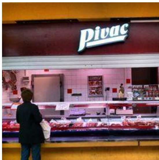
Slika 7. Mesnica Mesne industrije Braća Pivac d.o.o.

Svaka mesnica diljem Republike Hrvatske ima minimalno 2 klime te nekoliko rashladnih uređaja u kojima stoje naši proizvodi, ovisno o kvadraturi. A kada je riječ o kvadraturi to je obično 15-20 metara kvadratnih ako se mesnica nalazi u centru grada, a na svim ostalim mjestima je riječ od 30 do 50 kvadrata.