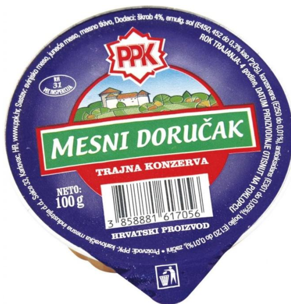
Slika 5. Mesni narezak Mesne industrije Braća Pivac d.o.o.

Kod konzervirane hrane potrebno je spomenuti mesni narezak te paštete: čajnu i jetrenu. 58