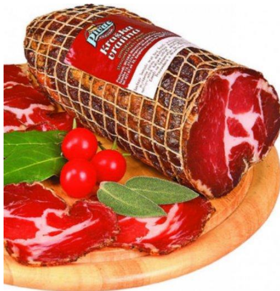
Slika 3. Kraški vrat Mesne industrije Braća Pivac d.o.o.

Kada je riječ o suhomesnatim proizvodima, Mesna industrija Braća Pivac d.o.o. u svojem asortimanu nudi pršut, pancetu, kraški vrat i pečenice.