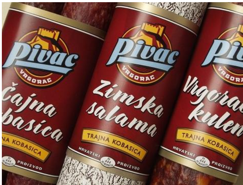
Slika 4. Trajne kobasice Mesne industrije Braća Pivac d.o.o.

Proizvodnja trajnih kobasica doživjela je svoj vrhunac u srednjem vijeku kada je prepoznata kao vrhunski proizvod bogatog aromatičnog okusa. Mješavine svinjskog, junećeg i janjećeg mesa urodile su širokom paletom trajnih salama koje i dan danas oduševljavaju gurmane širom svijeta. Jedinstvene recepture satkane od pažljivo biranih komada mesa i tisućljetne tradicije čine ovu deliciju vrhunskim trajnim proizvodom besprijekorne kvalitete. Trajni proizvodi u asortimanu Mesne industrije Braća Pivac d.o.o. su čajna kobasica, kulen, srijemska kobasica te zimsko salama. 57