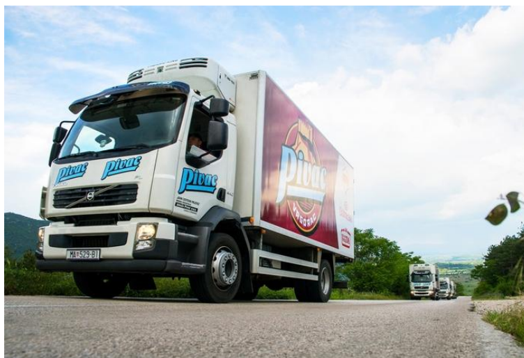
Slika 6. Hladnjača Mesne industrije Braća Pivac d.o.o.