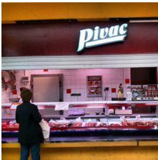
Slika 7. Mesnica Mesne industrije Braća Pivac d.o.o.

Svaka mesnica diljem Republike Hrvatske ima minimalno 2 klime te nekoliko rashladnih uređaja u kojima stoje naši proizvodi, ovisno o kvadraturi. A kada je riječ o kvadraturi to je obično 15-20 metara kvadratnih ako se mesnica nalazi u centru grada, a na svim ostalim mjestima je riječ od 30 do 50 kvadrata.