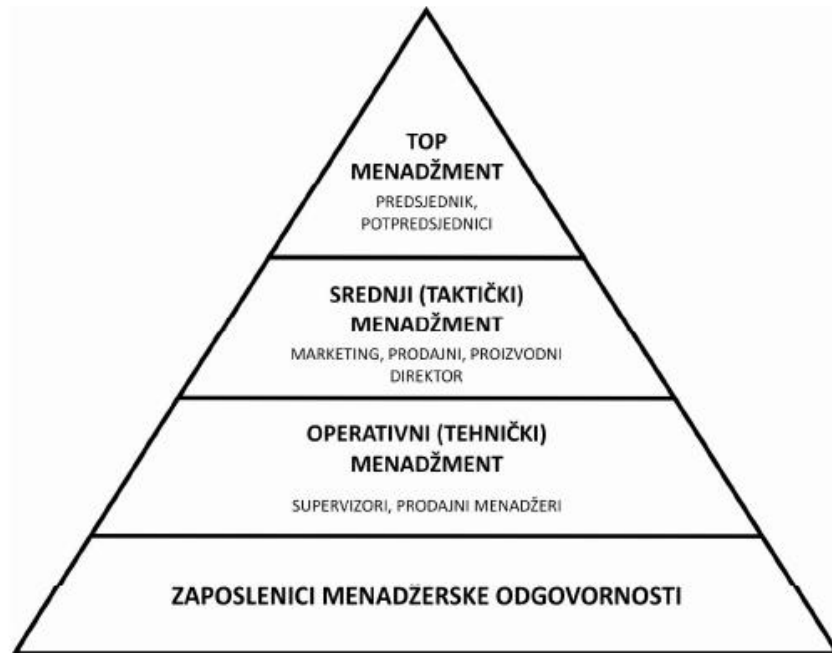
Slika 2. Razine menadžerske odgovornosti