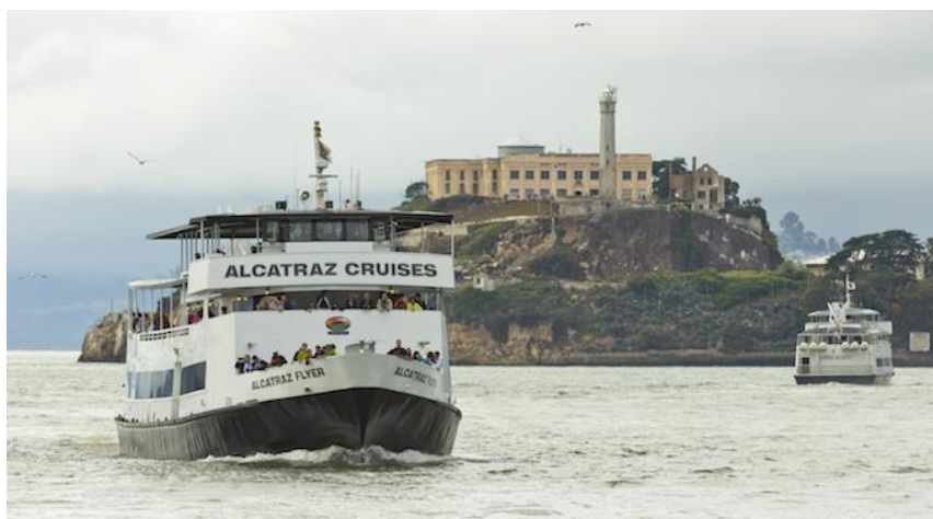
Slika 16: Prijevoz putnika do otoka