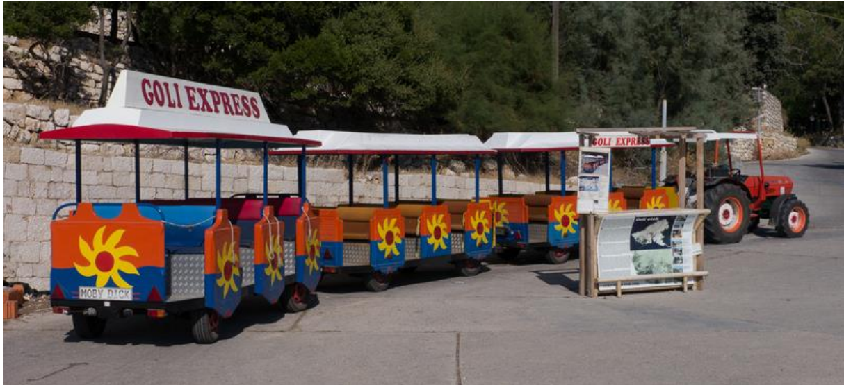
Slika 6: Turistički vlak na Golom otoku

razgledati predmeti iz nekadašnje svakodnevice ovoga mjesta. Tu se još nalaze mala suvenirnica i turistički vlakić "Goli express" s nekoliko vagona, koji vozi u sezoni i pokazuje etape pri gradnji logorskih i zatvorskih objekata. Osim toga postoje izleti i taxi prijevoz brodicama, a iz Lopara svakodnevno voze dvije linije za Goli otok.