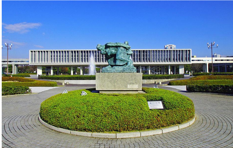
Slika 9: Memorijali muzej mira u Hiroshimi