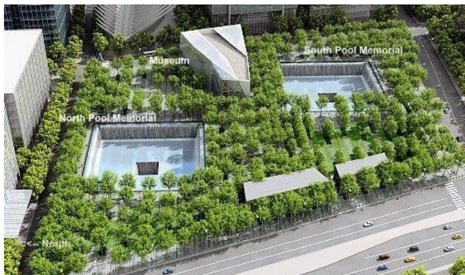
Slika 7: Ground Zero, memorijalni muzej i bazen

Svjetski trgovački centar, poznatiji kao Ground Zero, bio je kompleks od sedam građevina u donjem dijelu Manhattana u New York Cityju. Dva najviša tornja "Američki Blizanci" uništena su u terorističkim napadima 11. rujna 2001. zajedno sa zgradom broj 7. Rušenje dvaju tornjeva teško je oštetilo ostale zgrade kompleksa pa su s vremenom i one srušene, a tog dana stradalo je oko 3000 ljudi. U spomen na poginule izgrađen je memorijalni muzej i veliki reflektirajući bazen s vodopadima, a njihova imena ispisana su na brončanoj ploči na rubu memorijalnog bazena. Svake godine dobiva oko 1.000.000 posjetitelja.