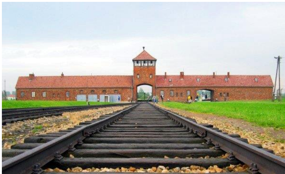
Slika 8: Ulaz u Auschwitz – Birkenau

Najveći koncentracijski logor nacističke Njemačke koji se nalazio se u Poljskoj, u blizini grada Oświęcim. Poznat je kao simbol holokausta, sustavnog “istrebljenja” Židova te ubojstva poljskih neistomišljenika od strane Nijemaca. Između lipnja 1941. i siječnja 1945. godine, milijun muškaraca, žena i djece poginulo je u 3 koncentracijska logora (Auschwitz I., administrativni centar, Auschwitz II. (Birkenau) kamp za istrebljivanje, i Auschwitz III. (Monowitz) radnički kamp). Koncentracijski logori su pretvoreni u Memorijalni centar i muzej u sjećanje na masovne žrtve s posjetom od oko 1.400.000 osoba svake godine. Posjetitelji kampa mogu vidjeti kako je izgledao dan zatvorenika, njihovo mučenje i zlostavljanje. Postoji i izložba umjetnosti, poezije i drame koju su zatvorenici radili za svoju obitelj.