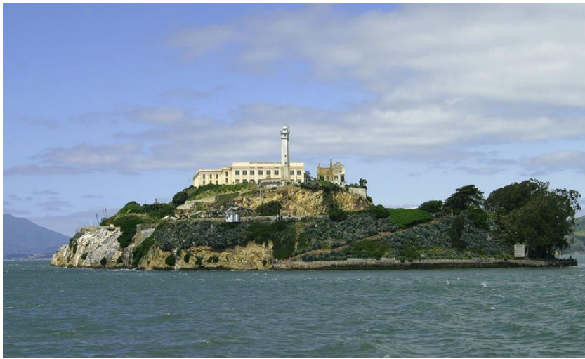
Slika 15: Otok Alcatraz

Sve do današnjih dana, Alcatraz je bio i ostao najpoznatiji među svjetskim zatvorima. Pored ćelija, dvorana, kula i svjetionika, turističku atrakciju također predstavljaju i impresivni vrtovi, koji su bili važan dio svakodnevice službenika, njihovih obitelji i zatvorenika vezanih za Alcatraz, bilo po kazni ili po dužnosti. Otok nudi niz staza, programa i izložaka koji tumače povijest otoka i prirodne resurse.