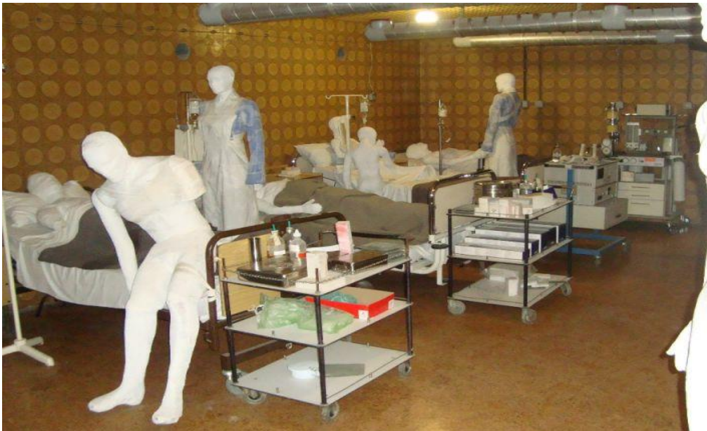
Slika 3: Mjesto sjećanja - Vukovarska bolnica 1991.

poginulim pripadnicima brigade. Posljednji lokalitet je Križ na ušću Vuke u Dunav, spomenik za sve one koji su dali život u borbi za neovisnu Hrvatsku.