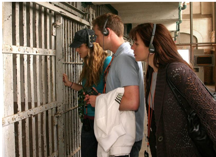
Slika 17: Audio vođenje po ćelijama

Posjetitelji imaju virtualni obilazak otoka putem zvučnih isječaka, videozapisa i slika. Nagrađivani obilazak bloka sa ćelijama i razgledavanje opremljeno je audio opremom koja pojačava doživljaj sa stvarnim glasovima zatvorenika, časnika i stanovnika koji prepričavaju sjećanja na život na Alcatrazu. Audio vodiči dostupni su na različitim jezicima (osim engleskog, uključuju francuski, njemački, talijanski, japanski, korejski, mandarinski, portugalski, ruski i španjolski). Vođenje traje oko 40 minuta te olakšava kretanje posjetitelja po zatvoru.