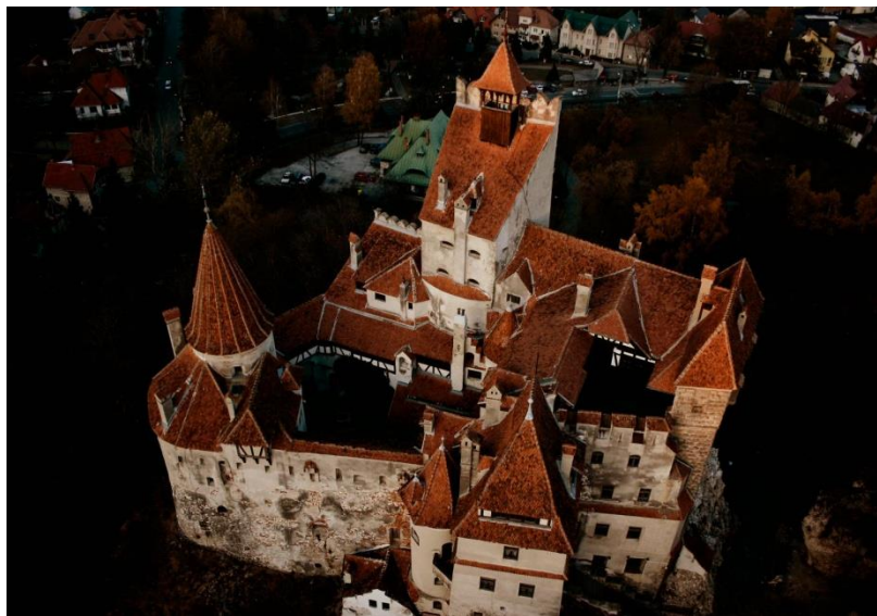
Slika 11: Dvorac Bran

Nalazi se 30km od Brašova. Dvorac je, navodno, sjedište Vlada III – koji je u 15.st vladao Vlaškom (današnja južna Rumunjska), poznatog i kao Vlad Drakula ili Vlad Probadač. Vlaška je u to doba bila pod stalnim napadima, a Vlad Probadač svoj je nadimak dobio zbog običaja da zarobljene Turke i protivnike pogubljuje nabadanjem na drveni kolac. Naziv vampira grofa Drakule dao mu je 1897. Bram Stoker, autor horor romana Dracula. Dvorac Bran danas je iznimno popularno mjesto za ljubitelje horora. Godišnje broji pola milijuna posjetitelja i obožavatelja vampira i legendi vezanih uz slavnog grofa Drakulu.