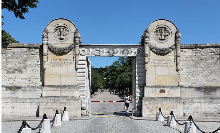
Slika 12: Glavni ulaz na groblje Père Lachaise u Parizu