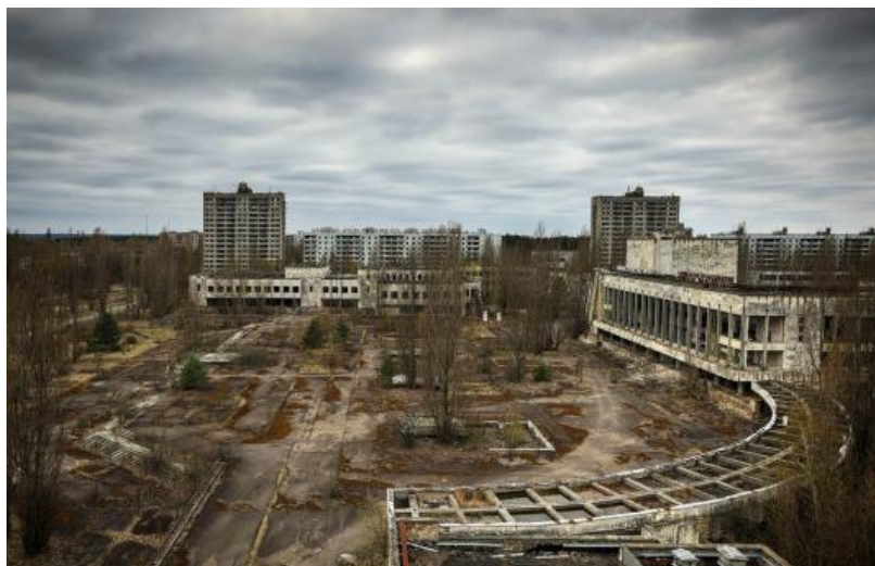
Slika 10: Grad Pripjat

Grad koji je bio dom 50.000 stanovnika, većinom radnika obližnje nuklearne elektrane Černobil. Nakon nuklearne katastrofe koja se dogodila u Černobilu 26. travnja 1986., grad je ostao napušten, ali danas ima više posjetitelja nego ikad. Područje koje je najviše zagađeno radijacijom je službeno nazvano "Černobilska zona isključenja". Zona uključuje turistički najposjećenije gradove Černobil i Pripjat te oko 180 evakuiranih sela. Nekoliko organizatora putovanja organizira izlete u Zonu isključenja i napuštena sela, od kojih je Pripjat jedan od najposjećenijih. Godišnje, Černobil broji više od 10.000 turista.