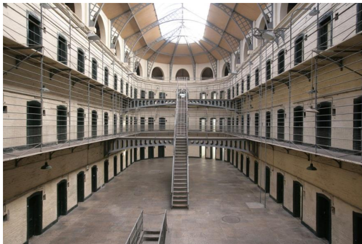
Slika 14: Kilmainham Gaol u Dublinu

Mnogo bivših zatvora danas je otvoreno za javnost i privlači veliki broj posjetitelja. Jedan od najpoznatijih je Alcatraz na kojem se nalazi kompleks zgrada istoimenog bivšeg zatvora koji je bio u funkciji od 1930-ih do 1960-ih godina. Na Alcatrazu su boravili i neki poznati kriminalci, poput gangstera Al Caponea. Ovo je mjesto danas jedna od najpopularnijih atrakcija u San Franciscu. Svake godine više od milijun posjetitelja ukrca se na brod za Alcatraz kako bi posjetili nekadašnje ćelije. Drugi poznati zatvor je Otok Robben u Južnoafričkoj Republici. Zbog prevelike udaljenosti kopna i opasnih hladnih struja koje su činile bijeg gotovo nemogućim, otok Robben je mogao postati „idealno“ mjesto za zatvor. Bio je dom za sve političke neprijatelje. Najpoznatiji zatvorenik bio je Nelson Mandela koji je ovdje proveo 18 od svojih 27 godina zatvora. Ture otokom dostupne su svakodnevno, a njih vode bivši politički zatvorenici. Kao odredište mračnog turizma poznat je i zatvor Kilmainham u Dublinu . Otvoren je 1796. godine u kojem se nalazila većina ključnih ličnosti uključenih u borbu za neovisnost Irske. Danas se tu nalazi muzej koji prikazuje povijest zatvora i njegovih korisnika, zajedno s poviješću irskog nacionalizma. Mogu se pronaći crteži, pisma i fotografije zatvorenika, a postoje i organizirane ture na kojima se može više naučiti o burnoj prošlosti Irske.