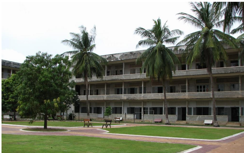
Slika 13: Glavni ulaz u Tuol Sleng

Kambodžanski autogenocid u rukama Crvenih Kmera između 1975. i 1979. bio je jedan od najtežih zločina u povijesti čovječanstva, gdje je ubijena četvrtina stanovništva te države. Glavni cilj bio je stvoriti potpuno besklasno i agrarno društvo u kojem će ljudi raditi isključivo fizičke poslove na polju i u šumama. Oko 13 km južno od glavnog grada Phnom Penha smješteno je nekoliko masovnih grobnica s komadićima ljudskih kosti ugrađenih u tlo. Tu se nalazi i muzej Tuol Sleng u kojem je nekad mučeno i pogubljeno preko 20.000 ljudi. Broj turista koji posjete mjesta genocida utrostručio se tijekom posljednjih 10 godina.