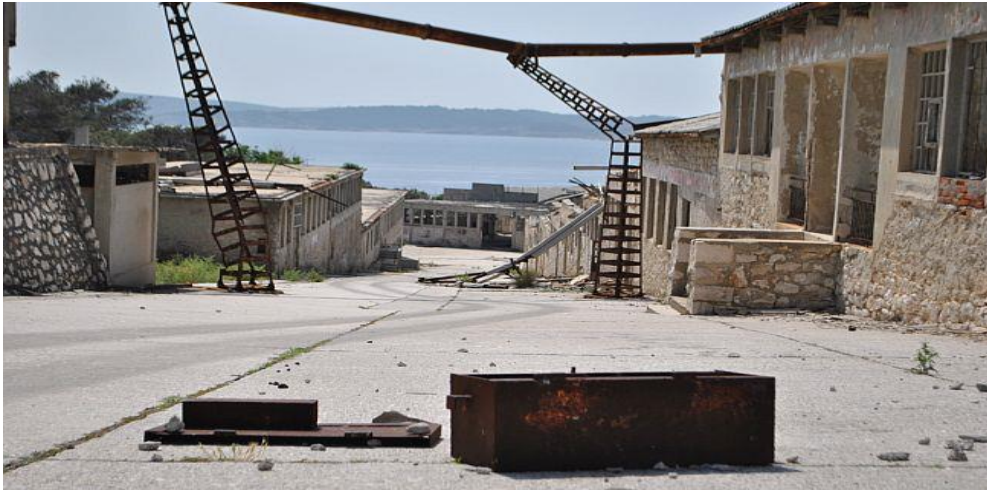
Slika 5: Zapuštene zgrade na Golom otoku

brodovima-cisternama." 25 Najvažnije zgrade označene su objašnjenjima na četiri svjetska jezika kako bi sadržaj približili turistima. Na Golom otoku danas postoji čitav niz devastiranih, ali postojanih objekata kaznionice te lučko pristanište koje je u mogućnosti izvršiti prihvat i većih brodova. Kaznionica čije se zapuštene zgrade i prateći objekti prema podacima DUUDI-a prostiru na 4.500 četvornih metara već godinama propada.