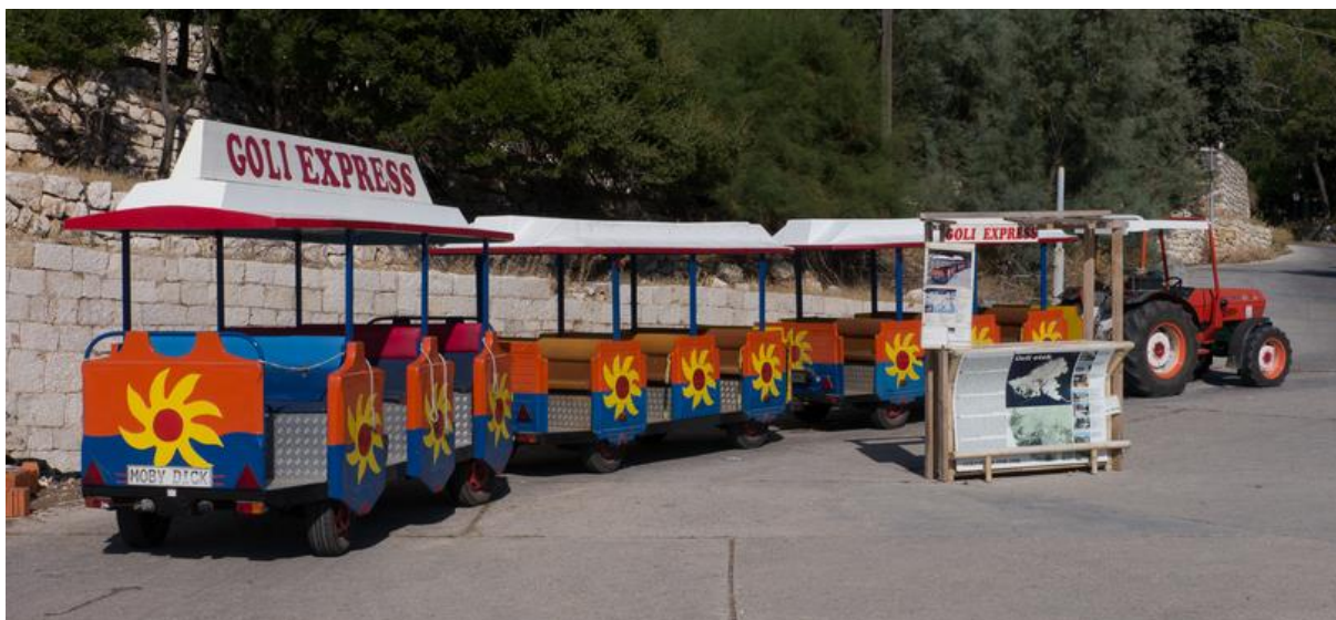
Slika 6: Turistički vlak na Golom otoku

razgledati predmeti iz nekadašnje svakodnevice ovoga mjesta. Tu se još nalaze mala suvenirnica i turistički vlakić "Goli express" s nekoliko vagona, koji vozi u sezoni i pokazuje etape pri gradnji logorskih i zatvorskih objekata. Osim toga postoje izleti i taxi prijevoz brodicama, a iz Lopara svakodnevno voze dvije linije za Goli otok.