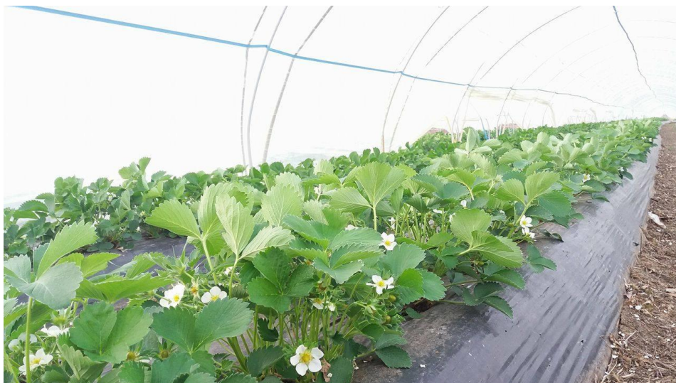
Slika 5. Jagode u cvatu

Nakon toga, u proljeće neki proizvođači svoje nasade pokrivaju agrilom ili prave na istima plastenike, da bi svoje nasade zaštitili od nevremena i leda, a samim time ubrzavaju rast biljke i ranije dozrijevanje plodova.