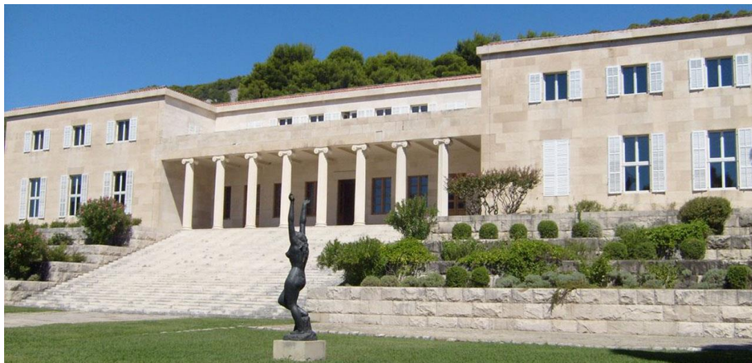
Slika 7. Galerija Meštrović