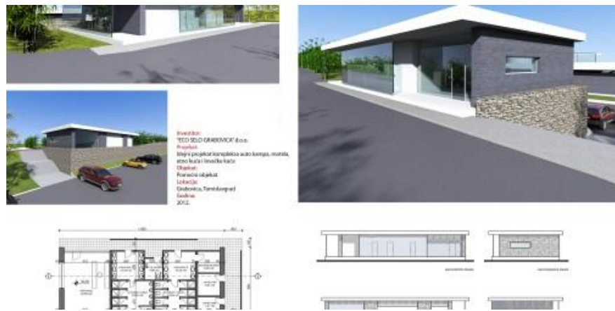
Slika 7.. Prikaz pomoćnog objekta