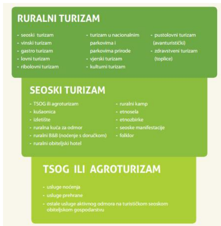
Slika 1. Razlike u vrstama turizma

Organizacija za ekonomsku suradnju i razvoj) prema kojemu su ruralna područja ona područja u kojima je gustoća naseljenosti ispod 150 stanovnika po km 2 ; odnosno kriterij Europske unije, gdje se kao prag uzima 100 stanovnika po km 2 .