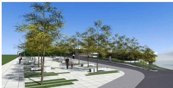
Slika 5. Prikaz šetnice