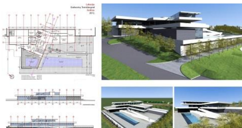
Slika 8.. Prikaz motela