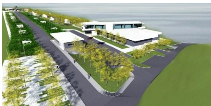
Slika 4. Prikaz auto kampa

Trenutno je završen idejni projekt izgradnje kompleksa autokampa, motela, lovačke kuće i etno kuće. Projekt je prikazan na sljedećim slikama.