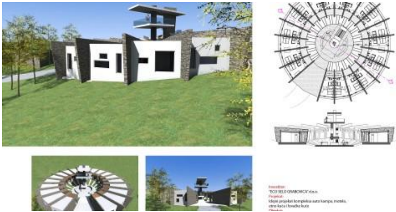
Slika 6.. Prikaz lovačke kuće