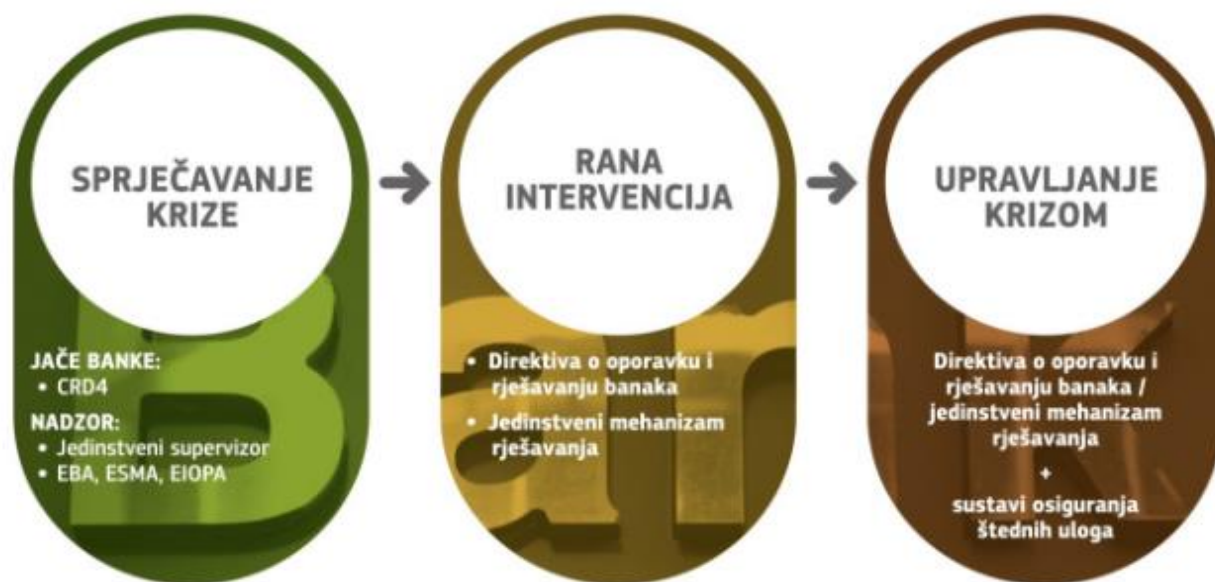
Slika 2: Stvaranje sigurnog bankarskog sektora

Stoga je cilj Europske bankarske unije stvaranje sigurnijeg bankarskog sektora na području Europske unije. Cilj je osigurati da sve banke budu sigurnije, da se osigura intervencija supervizora te da se osiguraju mehanizmi za upravljanje krizom. Preciznije, to su tri cilja prikazana na sljedećoj slici.