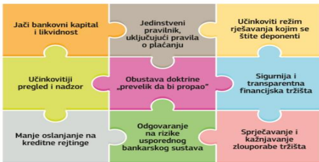
Slika 1: Ključni dijelovi slagalice financijske reforme diljem Europske unije