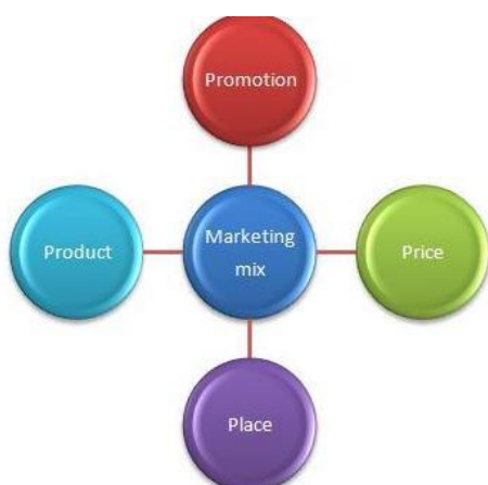
Slika 2: Elementi promotivnog miksa

Promociju možemo gledati i kao ključni element marketinškog miksa jer kad se proizvod uvodi na tržište glavno je da se on promovira na tržištu jer bez prave promocije proizvod ne može uspjeti. Za proizvode koji su već na tržištu i poznati su kupcima naglasak je na podsjećanje, odnosno utvrđivanje postojećih vjerovanja potrošača.