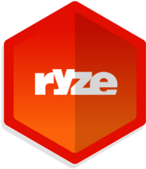
Slika 6. Logotip Ryze.com

d=0ahUKEwjckYGM2tjTAhUFM8AKHbqsDkgQFgghMAA&url=http%3A%2F%2Fhrcaak.srce.hr%2Ffile%2F188969&usg=AFQjCNHVU5n5oB0XgCpbSk3KgPPbjbFoYw&sig2=eZptbCZstX5tNm31KcH0VA , 22.08.2017.).