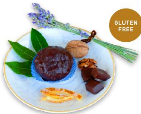
Slika 7

Ime asocirano oblikom topovske kugle, a na spomen svjetski poznate bitke u kojoj je zarobljen MARKO POLO i koja se odvijala baš ispred grada Korčule. Bombica “Marko Polo” je kreativni proizvod novog doba, koji će tek ući u korčulansku tradiciju. Riječ je o pravoj gluten free kalorijskoj bombi – kuglici od fine kreme, posute fino sjeckanim orasima, a zatim omotane debelim slojem čokolade. Kod ove deliciozne kombinacije dolaze na svoje obožavatelji čokolade.