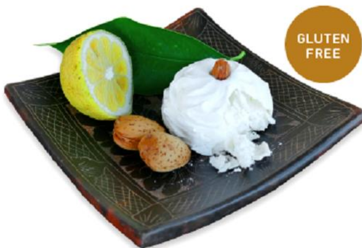
Slika 11

Ovi gluten free kolači rade se po staroj zaboravljenoj recepturi od bjeljanka šećera, vanilije i soka limuna. Spomilje je naziv od spomena na njihov okus i kad se jednom probaju nepce ih ne zaboravlja.