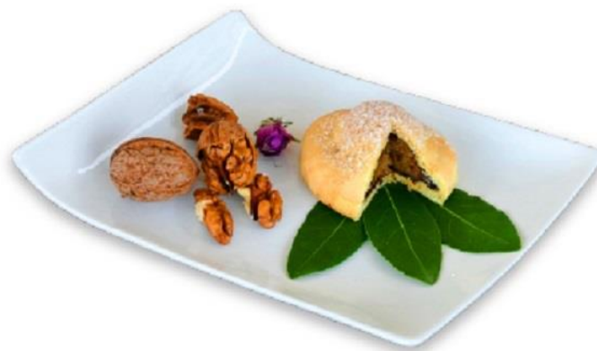
Slika 5

Također izrađen od istog svijetlog tijesta sa slatkim iznenađenjem u sredini! Kada zubi prođu kroz tanku opnu mirisnog, prhkog tijesta, zaustave se na moment na bogatom punjenju od oraha prožetom mirisnom esencijom domaće rakije od ruža. Svi ostali božanstveni okusi, koji se stvaraju u ustima daju se samo naslutiti.