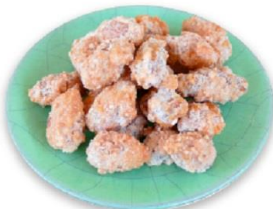
Slika 9

Mindele su Rimljani kao dar donosili prijateljima, a na vjenčanjima su bacali na mladence kao simbol plodnosti. Naše su none ili bake bruštulavale dugi niz godina do danas. Vrlo popularni, jednostavni slatki užitek.