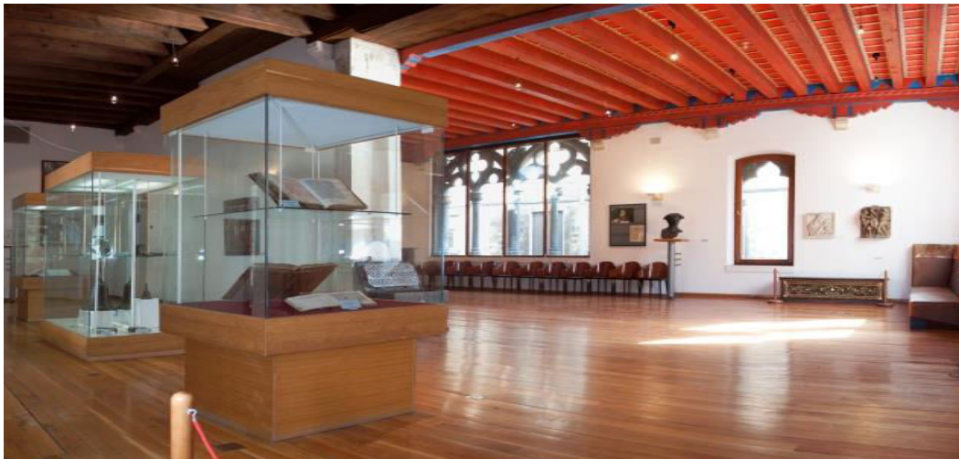
Slika 1. Svečana dvorana Papalićeve palače Muzeja grada Splita