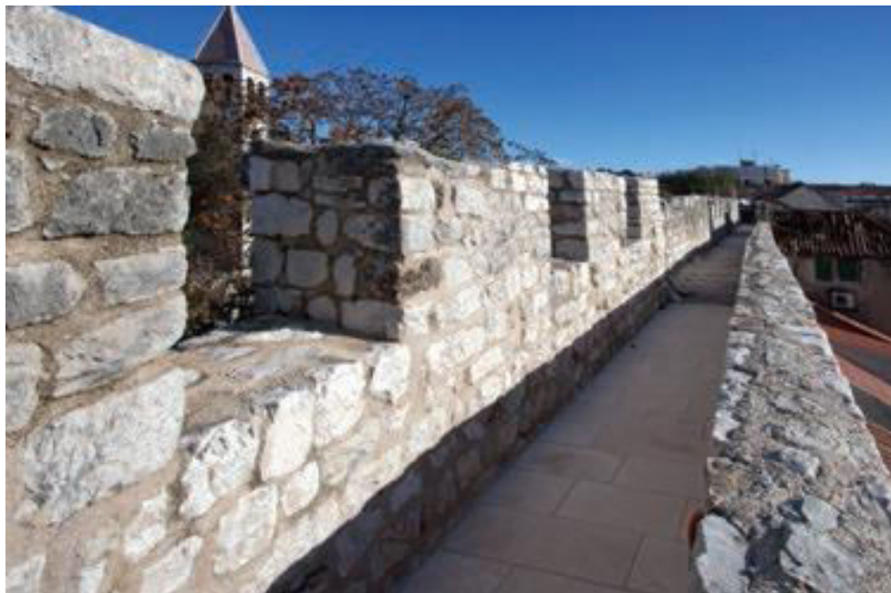
Slika 4. Šetnica poslije uređenja, 2014.