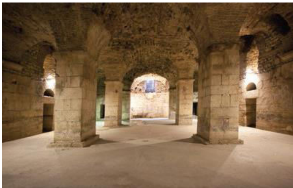
Slika 3. Velika trobrodna dvorana u zapadnom dijelu supstrukcija Dioklecijanove palače

Obala Hrvatskog narodnog preporoda bb, Split