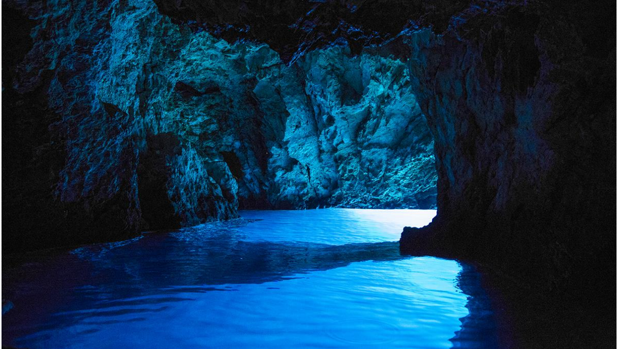
Slika 4: Modra špilja na otoku Biševu

špilje: Baraćeve špilje u Rakovici, špilja Baredine u Novoj Vasi, špilja Biserujka na otoku Krku, Feštinsko kraljevstvo u Feštini-Žminju, hvarska Grapčeva špilja, Lokvarka u Lokvama, Manita peć na Paklenici, Samograd u Perušiću, dugopoljska špilja Vranjača, fužinska špilja Vrelo i već spomenute Veternica, Cerovačke špilje i Modra špilja.