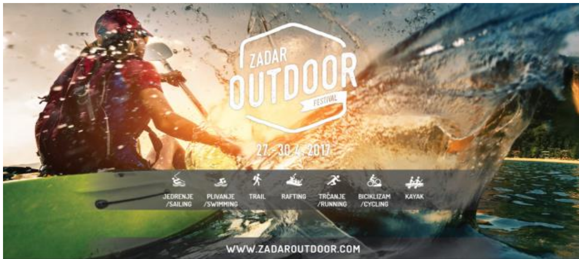
Slika 12: Logo Zadar Outdoor festivala

Od 27.04.2017. do 30.04.2017 na području Zadarske županije održan je prvi Zadar Outdoor festival, zajednički projekt nekoliko vodećih turističkih tvrtki koji je objedinio jedrenje, trail, plivanje, biciklizam, kajakarenje na moru, trčanje i rafting. Tako se područje Zadarske županije na četiri dana pretvorilo u igraonicu avanturizma za profesionalce, rekreativce i amatere raznih profila i interesa.