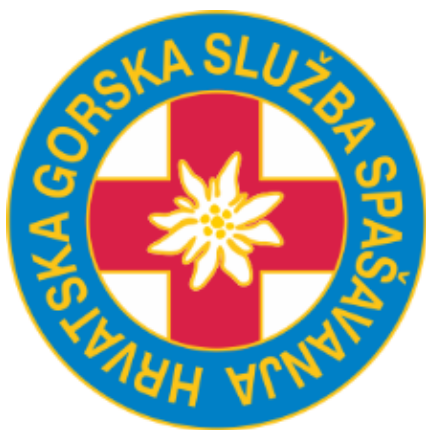
Slika 15: Logo Hrvatske gorske službe spašavanja