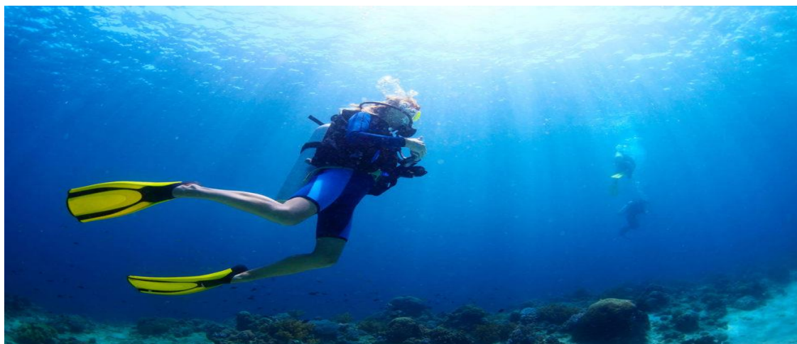
Slika 8: Ronjenje s bocama

Niska i razvedena obala, s brojnim otocima, uvalama i plažama tvore atraktivne krajobraze u Zadarskoj županiji, koji su već prepoznati i turistički valorizirani te se u njima provode brojne turističke aktivnosti. Neosporno je da je more osnovni turistički resurs na kojem se temelji turistička ponuda na ovom području. Obilježja mediteranske klime, razvedenost obale i iznimno pogodni vjetrovi zadarski i biogradski kanal čine vrlo atraktivnim i pogodnim za nautički turizam, i na kojima se već održavaju brojne regate sa međunarodnim sudjelovanjima. Podmorje otoka posebno je bogato ribom te ostalom podmorskom florom i faunom koja čini osnovu za razvoj ronilačkog i ribolovnog turizma.