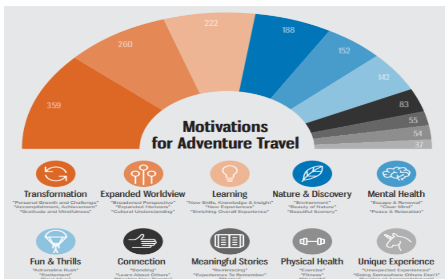
Slika 1: Motivi avanturističkih putovanja

U posljednjih desetak godina promijenili su se motivi avanturističkih putnika. Adventure Travel Trade Association(ATTa) je 2005. godine u suradnji sa znanstvenicima sa Michigan instituta provela istraživanje o avanturističkim putovanjima i motivima tih putovanja. Prema istraživanju izrazito značenje pridavalo se spoju prirode, fizičke aktivnosti i kulture, a turisti su poseban naglasak stavljali na rizik. Međutim, turizam je dinamičan sektor u kojem se neprestano mijenjaju trendovi i navike potrošača. Danas je rizik zanemaren, a naglasak je na prirodnom okruženju, istraživanju i učenju, povezivanju s drugima i jedinstvenim iskustvima. Avanturističko putovanje sve više postaje osobno iskušnje koje se temelji ne samo na fizičkoj sposobnosti već je prožeto emocionalnom i duhovnom percepcijom.