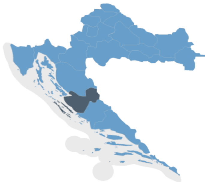
Slika 5: Položaj Zadarske županije na karti Republike Hrvatske

Zadarska županija smještena je u središnjem dijelu hrvatske obale Jadrana i sa svim svojim potencijalima zauzima važnu poziciju na karti hrvatske turističke ponude. Županija se proteže na 7.276,23 km 2 (8,3% ukupne površine Hrvatske), od čega 3.643,33 km 2 otpada na kopneni dio, a 3.632,9 km 2 na morski dio (Prostorni plan Zadarske županije, 2006). Obuhvaća obalu i otoke sjeverne Dalmacije, ravničarsko područje Ravnih kotara, krševito područje Bukovice, dio ličko-krbavskog brdsko-planinskog područja s Pounjem, krševito područje Velebitskog kanala te planinsko područje Velebita kao prirodnu granicu s kontinentalnom Hrvatskom i Likom. Administrativno, županija graniči sa Šibensko-kninskom, Primorsko-goranskom te Ličko-senjskom županijom. Županija u svom sastavu ima 34 jedinice lokalne samouprave, 6 gradova (Zadar, Benkovac, Biogradn/M, Obrovac, Pag i Nin) i 28 općina (Bibinje, Galovac, Gračac, Jasenice, Kali, Kolan, Kukljica, Lišane Ostrovičke, Novigrad, Pakoštane, Pašman, Polača, Poličnik, Posedarje, Poveljana, Preko, Privlaka, Ražanac, Sali, Stankovci, Starigrad, Sukošan, Sveti Filip i Jakov, Škabrnja, Tkon, Vir, Vrsi i Zemunik Donji). Administrativno središte županije je grad Zadar koji je po veličini peti grad u Republici Hrvatskoj i iznimno važno turističko središte.