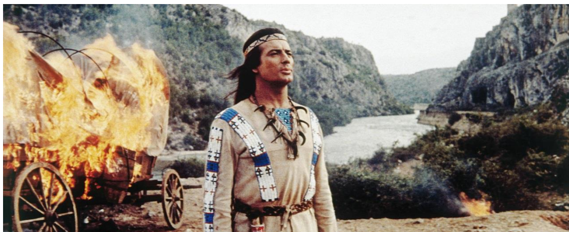
Slika 13: Snimanje filma „Winnetou“ u kanjonu rijeke Zrmanje

kanjona Zrmanje snimao se film o poglavici Winnetou prema knjizi njemačkog pisca Karl May-a, pa se svake godine tradicionalno organizira i manifestacija tragovima Winnetoua koja privlači brojne turiste, posebice iz Njemačke.