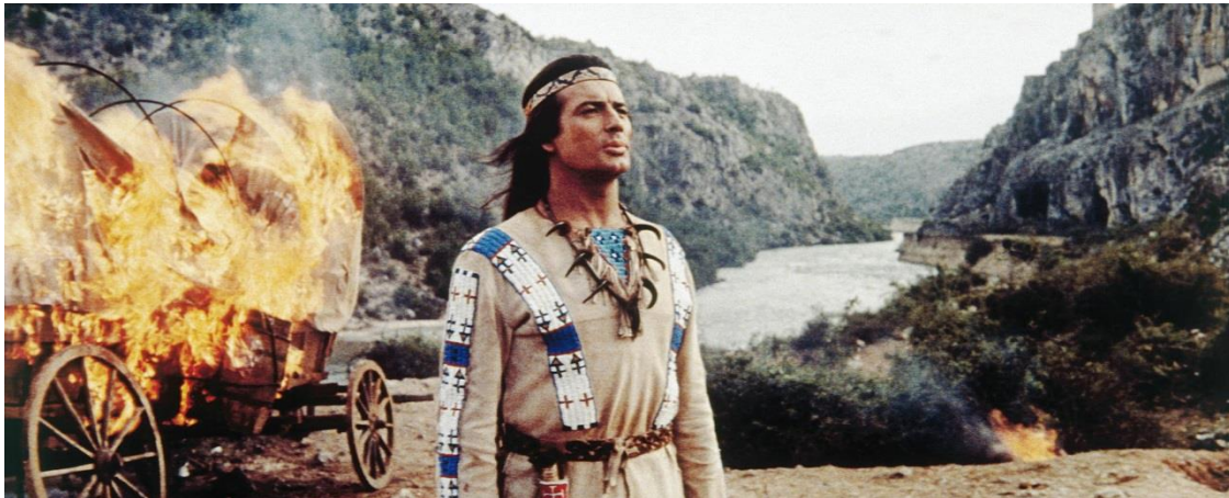
Slika 13: Snimanje filma „Winnetou“ u kanjonu rijeke Zrmanje

kanjona Zrmanje snimao se film o poglavici Winnetou prema knjizi njemačkog pisca Karl May-a, pa se svake godine tradicionalno organizira i manifestacija tragovima Winnetoua koja privlači brojne turiste, posebice iz Njemačke.