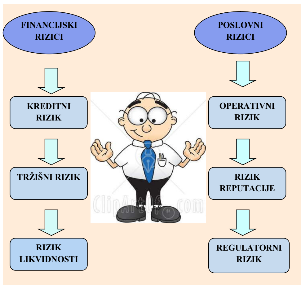
Slika 3 : Financijski i poslovni rizici

profitabilnosti bankovnog poslovanja. 49 Upravljanje rizicima kao kontrolna funkcija odabrane Banke na području Splitsko – dalmatinske županije organizirano djeluje u okviru Sektora za upravljanje rizicima u skladu sa Zakonom o kreditnim institucijama te internim direktivama i politikama. Temeljem prethodno provedene razdiobe rizika na dvije neformalno formulirane skupine, u nastavku svakoj skupini je pridružena odgovarajuća podskupina rizika. 50